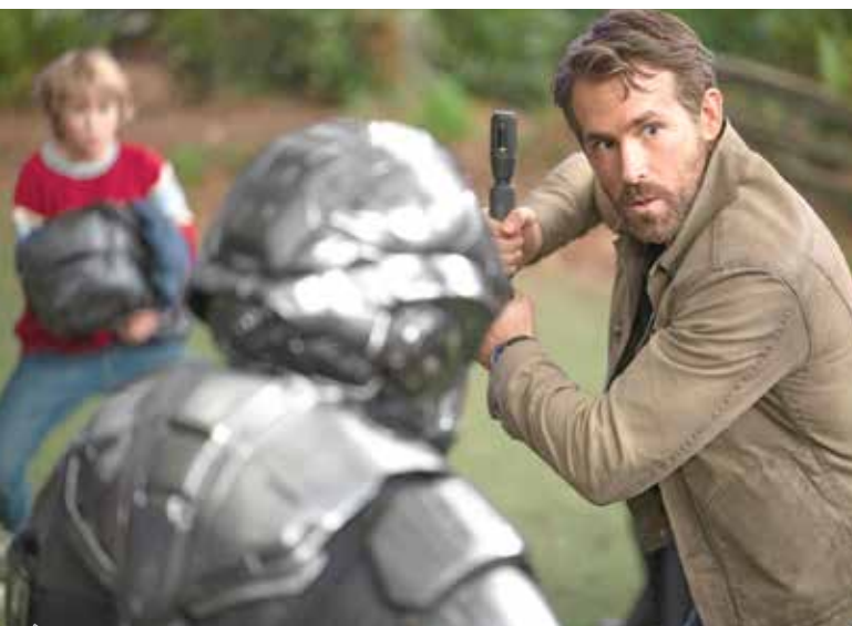
کارگردان: شان لهوی

جلب هرچه بیشتر مخاطبان است و بدیهی است که در این راه انواع کلک‌های تصویری و تروکا‌های بصری هم در دستور کار قرار گرفته باشد. البته هدف و رهاورد اصلی این گونه آثار سینمایی، ایجاد هیجان و تحرکی است که بر اثر آن فقدان قصه‌ای قوی در بطن فیلم نادیده گرفته شود و «جکاس» تازه هم از همین دستورالعمل نجات گرفته‌اند.