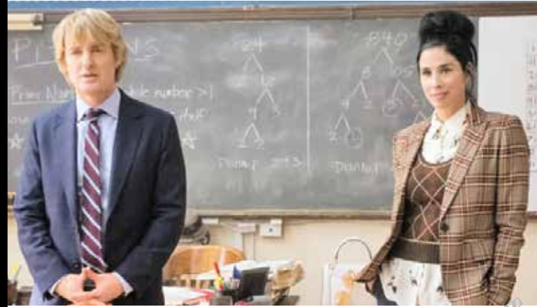
کارگردان: کت کوپرو

امینیتی مجرب را می‌بینیم که با کمک یکدیگر یک خرابکار بزرگ جهانی را سرکوب و سلاح بشدت مخرب او را از کارایی ساقط می‌کنند. اگر «کوئید» در کار نبود، این فیلم به جای اواسط مارس ۲۰۲۲ در اواخر ژانویه ۲۰۲۱ به نمایش درمی‌آمد.