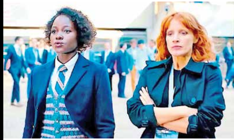
کارگردان: سایمون کینیرگ

سریال‌های تلویزیونی به تصویر کشیده شده است. نت فلیکس ساخت و حمایت مالی و توزیع این فیلم را هم برعهده داشته و بر اثر رونق فراوان کارش در دهه اخیر به مدارجی رسیده که طی سال ۲۰۲۲ به طور متوسط هر ۱۵ روز یک بار فیلمی جدید را عرضه می‌کند که اگر آن را نساخته باشد، لاقلاً توزیع و حق پخش جهانی آن را به خود اختصاص داده است. گیشه قوی و میزان توفیق فیلم‌های این کمپانی تازه که بسیاری‌شان در عین پخش در تماشایخانه‌ها روی سایت‌های این کمپانی هم قابل دانلود و تماشای آنلاین است، نوید موفقیتی شایان توجه برای «پروژه آدم» را هم می‌دهد.