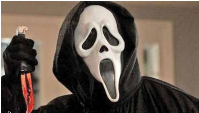
کارگردان: مت بتینلی اولین و تایلر جلیلت

یک فیلم بلند فیچر برای «دومی شی» شرق آسیایی است که در سال ۲۰۱۸ جایزه اسکار بهترین کارتون کوتاه را برای فیلم «بانو» برد. دیگر ویژگی «قرمز شدن» این است که دیسنی و پیکسار همزمان با اکران این فیلم در تماشایخانه‌های جهان امکان دانلود و تماشای آن را روی سایت‌های اینترنتی خود هم در ازای دریافت وجوه تعیین شده فراهم می‌آورند و از این طریق سودی مضاعف انتظار کانال «دیسنی پلاس» را هم می‌کشد.