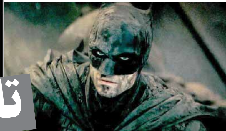
کارگردان: مت ریوز

بازیگران: رابرت باتینسون، جفری رایت، رو کرویتز، بل دانو، جان تورتورا، پیتر سارگارد، اندی سرکیس و کالین فارل