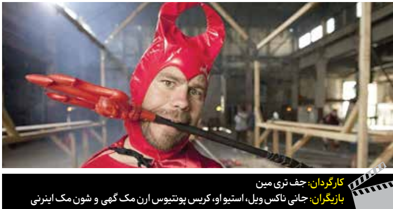
کارگردان: جف تری مین

۲۰۲۰ انجام و کامل شد و دلیل عدم پخش آن در سال ۲۰۲۱ ضرر کلانی بود که اکران آن در ایام سوت و کور شده کرونا به وجود می‌آورد. چنان اقدامی کمپانی سازنده فیلم را بشدت متضرر می‌کرد و امروز که شرایط جهان قدری بهتر و این بیماری بیشتر از سال پیش تحت کنترل قرار دارد، پیش‌بینی فروش حدود یک میلیارد دلاری و یا قدری کمتر از آن برای این فیلم یک بلندپروازی بیپوده و خوشبینی صرف نیست.