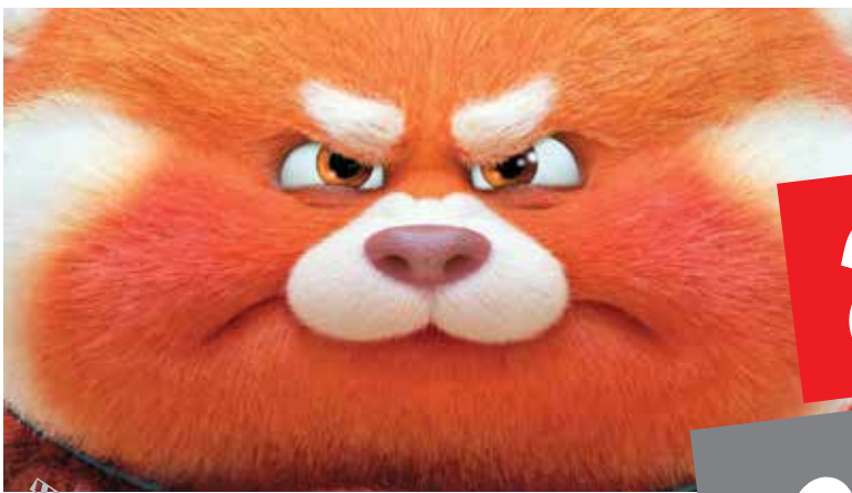
کارگردان: دومی شی

صدایشه‌ها: روزالی چیانگ، ساندر او و جیمز هونگ