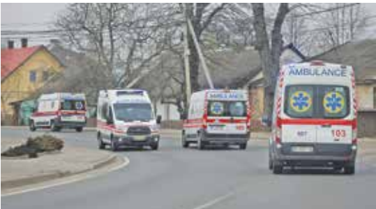
در پی حمله روسیه ۱۹ آمبولانس راهی پایگاه نظامی «یافوروف» شدند |

در این حمله موشکی ۳۵ نظامی کشته و ۱۳۴ نفر از آنان زخمی شدند گروه جهان ارتش روسیه در ادامه حملات خود به تجهیزات نظامی اوکراین، به پایگاه نظامی «یافوروف» که بزرگترین و یکی از مهم‌ترین پایگاه‌های ارتش این کشور در نزدیکی مرزهای لهستان است، حمله کرد. به گزارش خبرگزاری «رویترز»، در حملات موشکی ارتش روسیه به پایگاه نظامی «یافوروف» که در نزدیکی مرز لهستان قرار دارد، ۳۵ نظامی اوکراینی کشته و ۱۳۴ نفر از آنان مجروح شدند. این حمله در حالی انجام شد که در گذشته نیروهای نظامی خارجی نیز در این پایگاه حضور داشتند اما مشخص نیست نیروهای خارجی که در این پایگاه مستقر بودند، در زمان حمله در