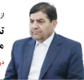
در صفحه سیاسی بخوانید