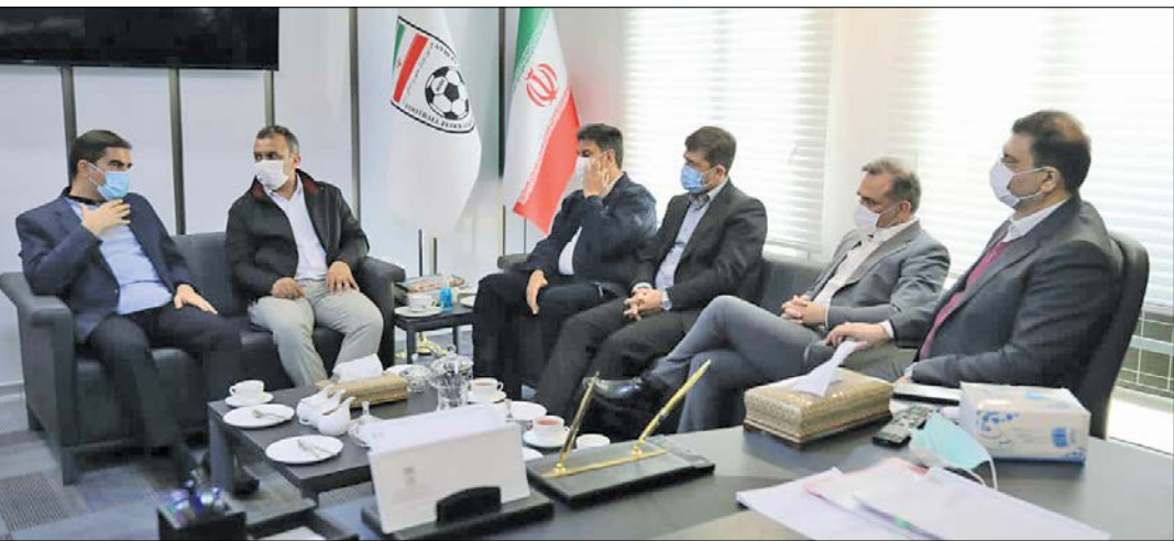
جلسه چندی پیش فراکسیون ورزش مجلس با اعضای هیأت رئیسه فدراسیون فوتبال پس از عزل عزیزی خادم

محمد مهدی فروردین، رئیس فراکسیون ورزش مجلس در گفت و گو با «ایران»: با کمک وزیر راه تیم ملی با پرواز اختصاصی به کره می رود