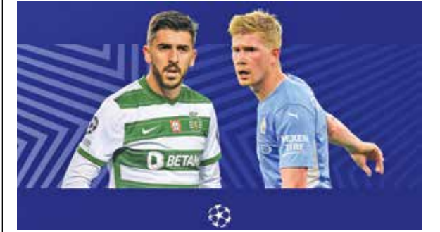
۳۰:۲۳ امشب؛ منچستر سیتی - لیسبون در لیگ قهرمانان اروپا

در صورتی که بازیکنان آرسنال بتوانند برای اولین بار پس از سال ۲۰۱۷ تیم‌شان را به لیگ قهرمانان اروپا برسانند، مسئولان این باشگاه به هر کدام از بازیکنان پاداشی به ارزش ۵۰۰ هزار پوند خواهند پرداخت. آرسنالی‌ها در جدول منچستریونایتد را پشت سر گذاشتند و فعلاً با سه بازی کمتر و یک امتیاز بیشتر به جایگاه چهارم جدول رسیده‌اند، جایگاهی که صعود آنها به بزرگ‌ترین لیگ باشگاهی اروپا را در فصل بعد تضمین می‌کند. آرسنال یک امتیاز از یونایتد جلوتر است اما سه بازی در پیش دارد. اگر آرسنال بتواند به غیبت ۵ ساله‌اش پایان بدهد، با جواز نقدی لیگ