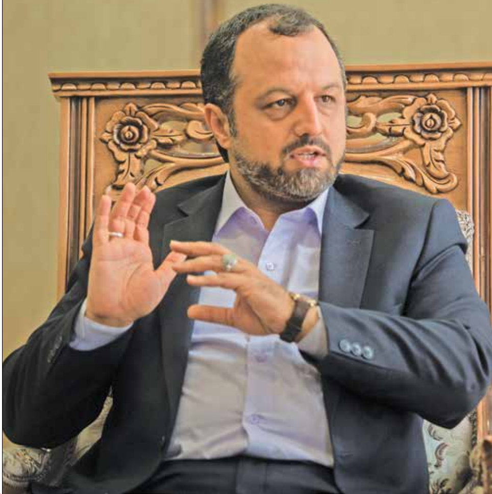
تفاوت فصلی / ایران