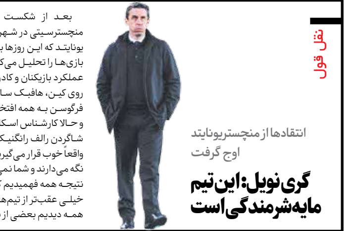
انتقادها از منچستریونایتد اوج گرفت

لیورپول هر هفت بازی خود در این فصل لیگ قهرمانان را برده است. این تیم همچنین در ۱۲ بازی اخیر خود در تمامی رقابت‌ها ۱۲ برد داشته است. آنها با برد برابر اینتر