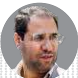
رضا مراد صحراعی وزیر امور و پیشه‌پروری

رتبه‌بندی معلمان در مرحله رسیدگی به شکایات است روند رسیدگی به اعتراضات باید یک پله بالاتر بررسی شود؛ اگر کسی رتبه شهرستانی دارد اعتراض او باید در استان مربوطه مورد پیگیری واقع شود.