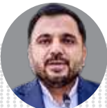
عیسی زارع پور وزیر ارتباطات و فناوری اطلاعات

ضرورت اصلاحات در صندوق‌های بازنشستگی صندوق‌های بازنشستگی با مشکل ناپایداری جدی مواجه شده‌اند؛ باید اصلاحاتی در حوزه مدیریت و شیوه‌های اداره صندوق‌ها لحاظ شود.