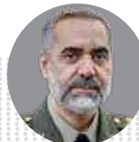
محمد رضا آشتیانی وزیر دفاع و پشتیبانی نیروهای مسلح

حريم خصوصی کاربران ایرانی محترم شمرده می‌شود گوگل پلی با برخی بازی‌های پرکاربرد و سرویس‌هایی که مردم به آن احتیاج دارند، باید دوباره بررسی شود زیرا بخشی از نارضایتی مردم ناشی از اینهاست.