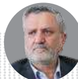
صولت مرتضوی وزیر تعاون، کار و رفاه اجتماعی

رتبه‌بندی معلمان در مرحله رسیدگی به شکایات است روند رسیدگی به اعتراضات باید یک پله بالاتر بررسی شود؛ اگر کسی رتبه شهرستانی دارد اعتراض او باید در استان مربوطه مورد پیگیری واقع شود.