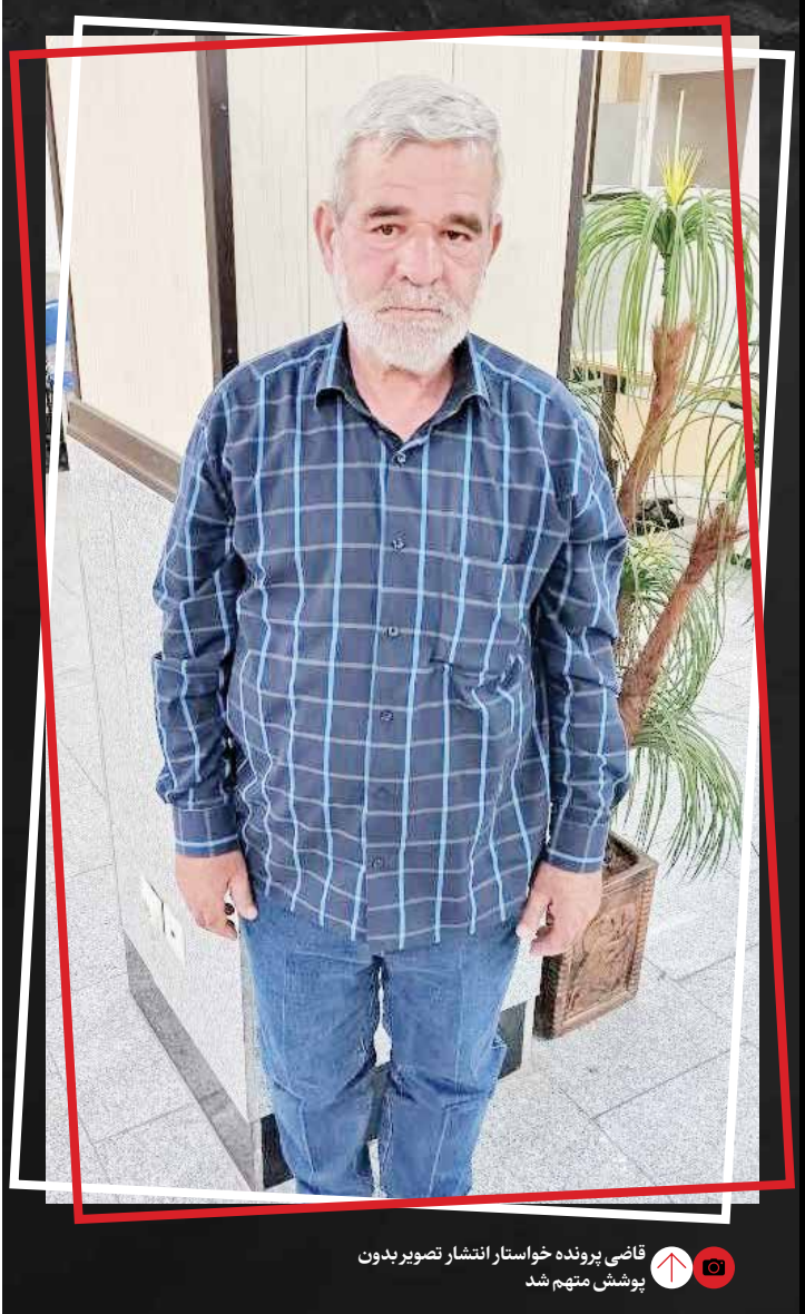
قاضی پرونده خواستار انتشار تصویر بدون پوشش متهم شد

تصاویری به دست آمده کیفیت پابینی داشت و هیچ ردی از روبا‌ه‌پیر به دست نیامد، اما تحقیقات برای دستگیری این مرد ادامه داشت. گرم معما باز شد تجسس‌ها ادامه داشت تا اینکه بعد از ۳ سال یعنی اوایل اردیبهشت ماه امسال یک زن دستفروش با پلیس ۱۱۰ تماس گرفت و عنوان کرد مردی با چهره‌ای فریبنده خودش را سردار یک ارگان نظامی معرفی کرده و ادعا می‌کند می‌تواند برایم وام جانبازی بگیرد و با این ترغیب و اعتمادسازی قصد نیت شومی داشت که متوجه