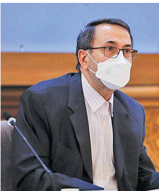
معاون وزیر راه و شهرسازی گفت: در قانون بودجه امسال تلاش بسیاری شده که در تمام محدوده هایی که به عنوان اسکان غیر رسمی شناخته شده و داخل محدوده هستند سند داده شود.

سؤال ویژه ■ حذف تدریجی ارز ۴۲۰۰ تومانی واردات برخی کالاها را اساسی، قرار است دولت قیمت های جدید این کالاها را تعیین و اعلام کند. تأکید مسئولان بر این است که افزایش قیمت کالاها نباید بهانه ای برای افزایش قیمت در بخش حمل و نقل بویژه حمل بار باشد. برای جلوگیری از افزایش قیمت حمل بار چه اقداماتی را در نظر گرفته اید؟ حمل و نقل فقط تابع مقررات است. تعاملات منطقه ای را دولت برای حمل و نقل خصوصی فراهم می کند. ما ارزیابی مقطعی را از رفع موانع رشد ترانزیت خواهیم داشت. مسیر در شورای عالی ترابری ترسیم شده است، ذینفعان مختلف باید در مسیر برای جابه جایی بار از ایران را افزایش جذب بار عبوری از کشور نقش خود را به خوبی ایفا کنند.