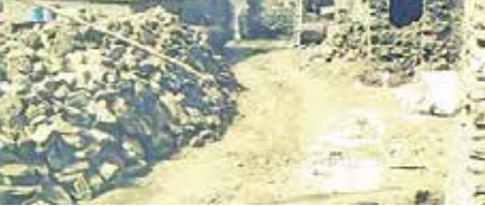
نمایی از زندان دولتو، محل نگهداری مدافعان مصامت ارضی کشور

را به اولین پایگاه رساندم اما گزارش داده بودند که در آنجا خودم را به کار کردم. آن موقع خانواده‌ام برگشتم. آن ایام کومله‌ای‌ها شروع به تهدید کردند (با تارتجک و