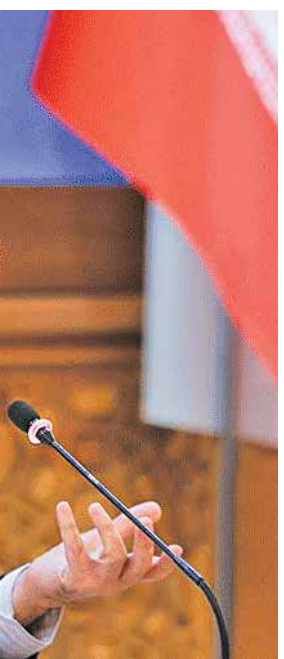
شورای عالی ترابری افزایش حدود ۲ برابری ترانزیت را مصوب کرده است.

برای افزایش ترانزیت بار از کشور باید ۵ برنامه را که هدف گذاری کرده ایم در مقاطع زمان بندی شده اجرا کنیم. اول اینکه باید مشخص شود هر سه ماه چه مقدار ترانزیت بار باید داشته باشیم. دوم اینکه برنامه و وظیفه سازمانها و شرکت هایی که در حمل و نقل نقش دارند، مشخص شود. سوم جابه جایی را برداریم، چهارم اینکه قطعا نقش بخش حمل و نقل خصوصی بسیار مهم است، بخش خصوصی برای انعقاد قراردادهای حمل و نقلی با کشورهای منطقه باید فعال شود و پنجم حمایت های دولت از بخش حمل و نقل و ترانزیت است. راهکارهای