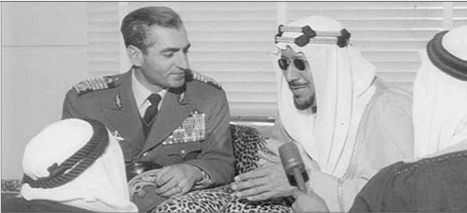
۲۴ مرداد سال ۱۳۵۰، شاه پهلوی استقلال بحرین را تبریک گفت. سرزمینی که تا پیش از آن، استان چهاردهم ایران بود. حتی از عضویت بحرین در سازمان ملل هم حمایت کردند درحالی‌که خود اعراب مخالف بودند! | مهر و

گفت و گوی «ایران» با یعقوب توکلی به مناسبت سالروز «جدایی بحرین از ایران»