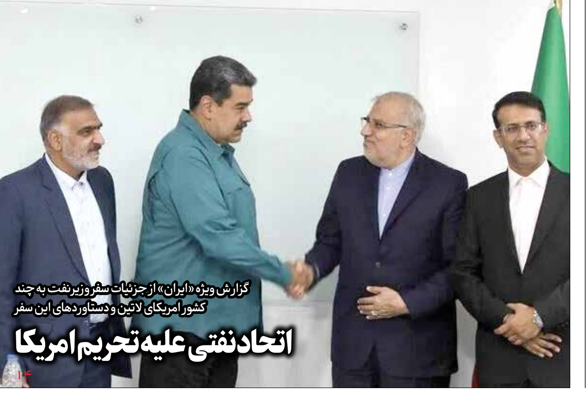
گزارش ویژه «ایران» از جزئیات سفر وزیر نفت به چند کشور آمریکایی لاتین و دستاوردهای این سفر