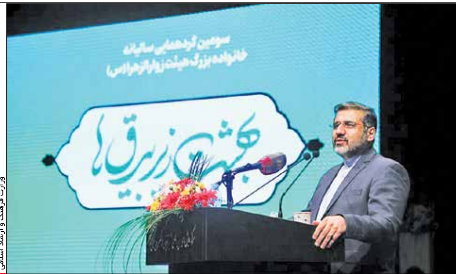
وزارت فرهنگ و ارشاد اسلامی

وزیر فرهنگ و ارشاد اسلامی در اختتامیه سومین رویداد ملی «فهما»: