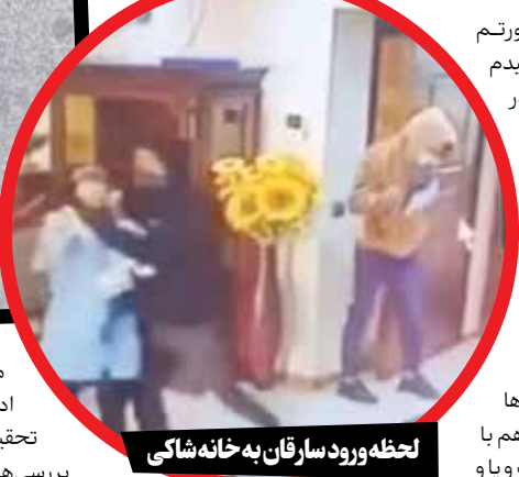
لحظه ورود سارقان به خانه شاکلی

در حال تعویض پانسمن صورتم بودم. ناگهان سر و صدایی شنیدم اما تصور کردم که بچه‌ها در حال بازی هستند. اما وقتی در اتاق را باز کردم ناگهان مرد ناشناسی به طرفم حمله کرد و دستش را روی دهانم گذاشت بعد مرا با زور داخل اتاق انداخت. با اینکه عمل کرده بودم و نمی‌توانستم چسب بستم. بعد هم بقیه بچه‌ها و خدمتکار و دختر عمه‌ام را هم با همین شیوه کتک زدند و دست و پا و دهانمان را بستند برایم عجیب بود که سارقان به خانه ما آشنایی داشتند و فقط اتاق همسرم را جست‌وجو کردند و بعد از ۴۰ دقیقه هم رفتند. در حالی که داشتم خفه می‌شدم دختر ۵ ساله‌ام با دستان کوچکش به سختی دهانم را باز کرد و بعد هم با ناخن‌گیری که در کیفم بود دستانم را باز کردیم. با عجله به سمت در خانه رفتم اما متوجه شدم سارقان در راه پشت با سمیم جاروبرقی به در دیگری بسته‌اند. دوباره بچه‌ها با کلی زحمت موفق شد سمیم را باز کنند و ما آزاد شدیم. سارقان حدود یک میلیارد تومان سرقت کرده‌اند. به غیر از سرقت آنها پسر کوچکم را هم کتک زده و باعث شده‌اند بچه‌ام دچار مشکلات جسمی و روحی شود.