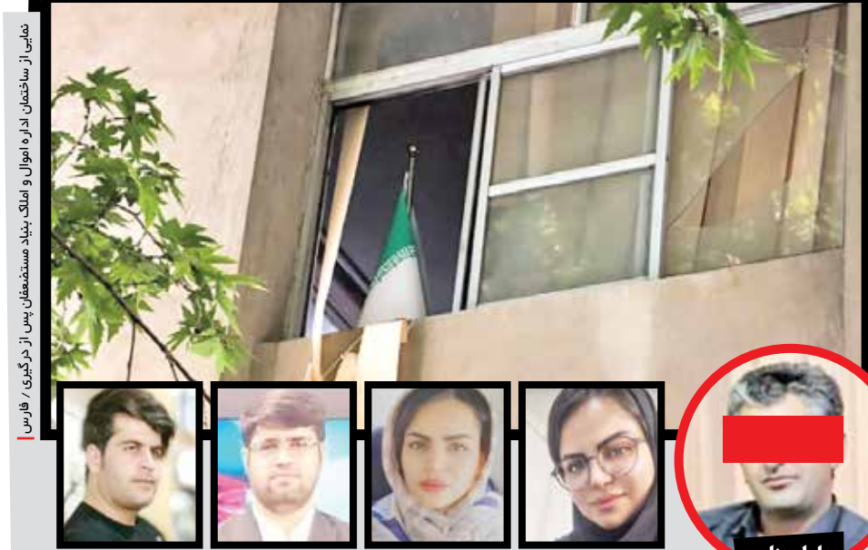
شعبه ۱ از ساختمان اداره اموال و املاک بنیاد مستضعفان پس از درگیری / فارس