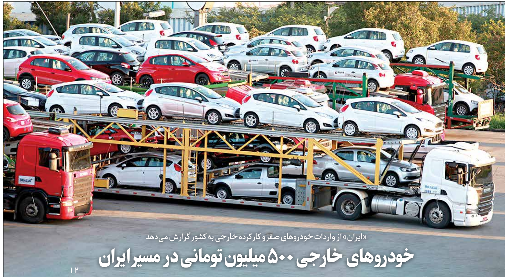
«ایران» از واردات خودروهای صفر و کارکرده خارجی به کشور گزارش می‌دهد

«اجماع بین مسئولان»، «اتفاق افکار عمومی» و «حمایت از منافع مردم» سه اصل دولت در اجرای تصمیمات مهم اقتصادی است