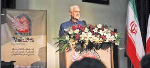
ایران در ایران

اصفهان پناهگاه ۲۶۰۰ کودک لهستانی بوده است