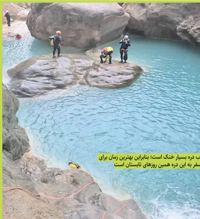
آب دره بسیار خنک است؛ بنابراین بهترین زمان برای سفر به این دره همین روزهای تابستان است