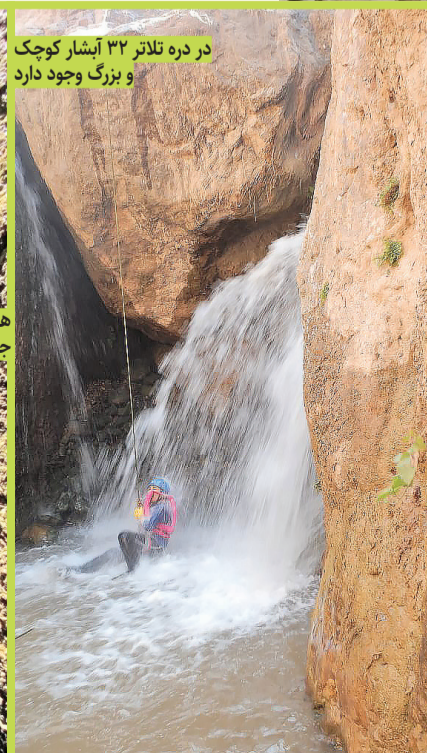
در دره تلاتر ۳۲ آبشار کوچک و بزرگ وجود دارد