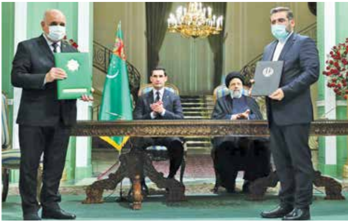
امضای موافقتنامه رسانه ای بین مدیرعامل ایرنا و مدیرعامل «تی دی ایچ»

رئیس جمهور جدید ترکمنستان سه شنبه با دعوت رسمی رئیس جمهور کشورمان در رأس هیأت بلندپایه سیاسی و اقتصادی از این کشور شده است. این نخستین سفر بری محمداف به تهران در مقام ریاست جمهوری ترکمنستان است و پیش از این در ۱۹ دی ۱۴۰۰ به عنوان فرستاده ویژه رئیس جمهور وقت این کشور به ایران آمده بود. محمداف که پیش از این معاون وزیر امور خارجه ترکمنستان بود، ۲۸ اسفند سال گذشته به عنوان رئیس جمهور این کشور برگزیده شد. آیت الله رئیسی پیش تر در دیدار محمداف به عنوان فرستاده ویژه رئیس جمهور ترکمنستان گفته بود که تهران از پیشنهاد های طرف مقابل در زمینه تحکیم و ارتقای همکاری