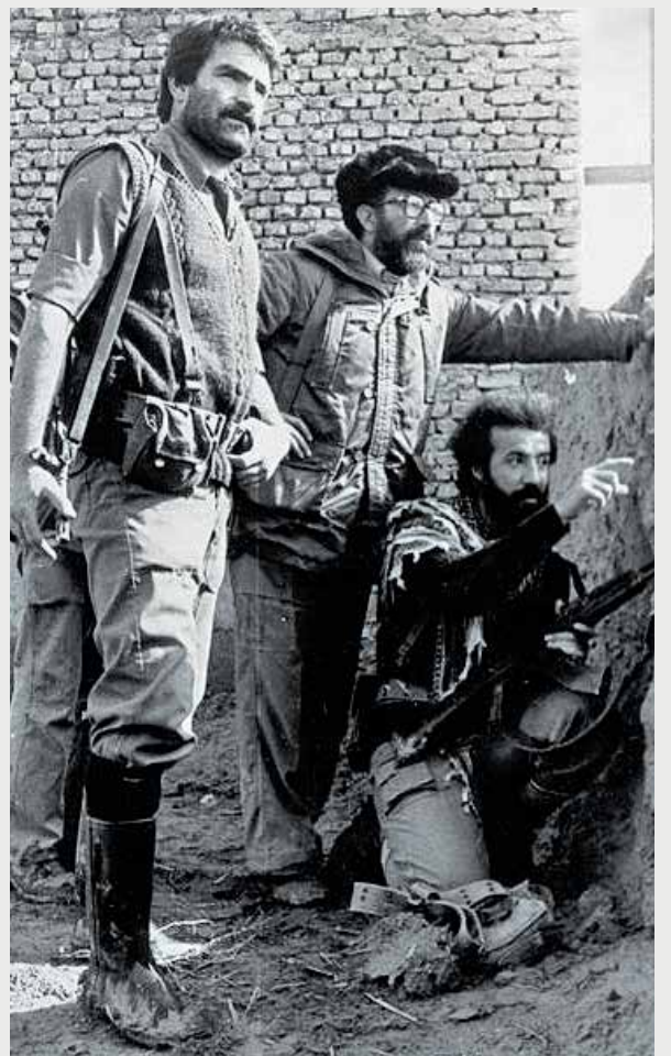
حضور دکتر چمران به عنوان وزیر دفاع در میان درگیری‌های مناطق جنگی / ۱۳۶۰