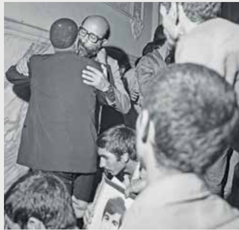
مراسم سالگرد شهادت شهدای پایه / / ۳۰-۰۵-۱۳۵۹