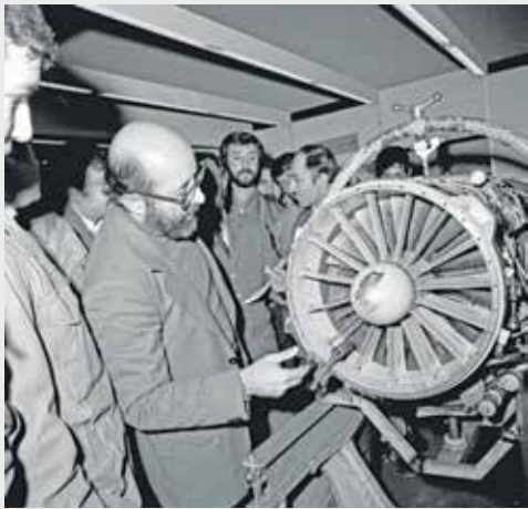
بازدید دکتر چمران از تجهیزات نظامی در حاشیه سمینار رهایی از سلطه صنعتی آمریکا / / ۰۶-۱۰-۱۳۵۸