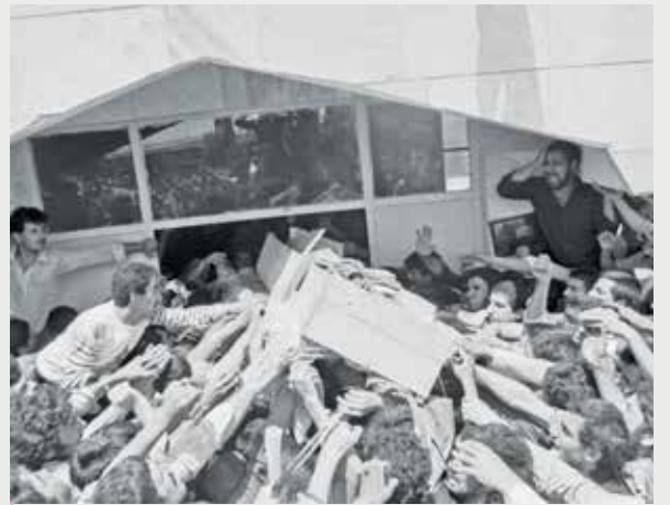
تشییع پیکر شهید دکتر چمران در تهران / / ۰۲-۰۴-۱۳۶۰