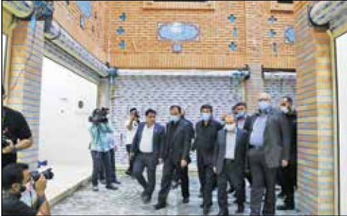
بازار سنتی فیدوس