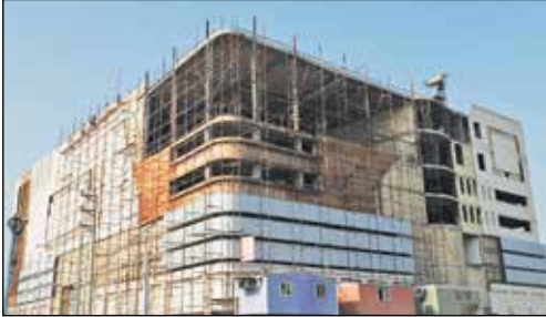
پارکینگ طبقاتی طالقانی

http://irannewsaper.ir editorial@irannewsaper.ir