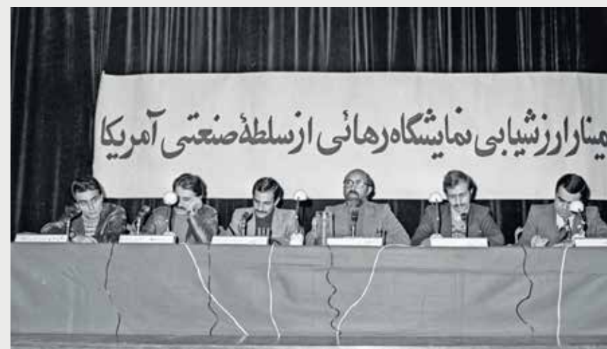
حضور وزیر دفاع در سمینار رهایی از سلطه صنعتی آمریکا / ۰۶-۰۱-۱۳۵۸