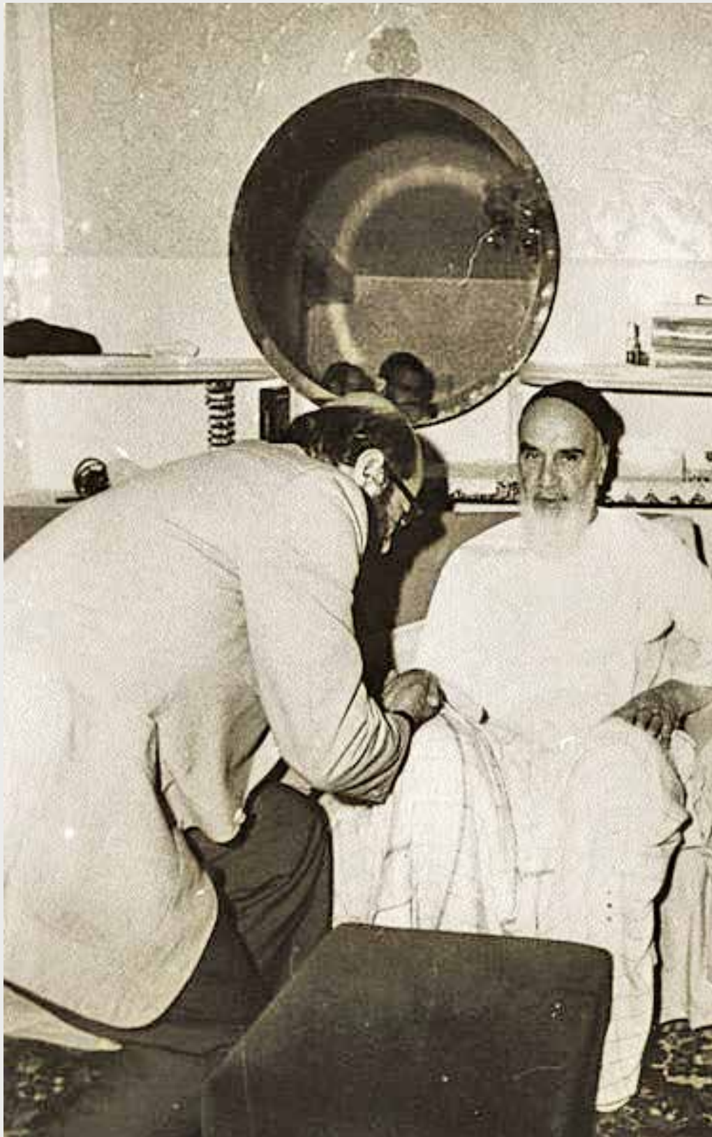
وزیر دفاع در دیدار با امام / ۱۳۶۰