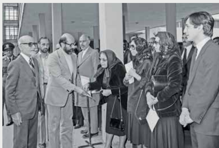
مراسم سالروز شهادت تیمسار قرنی با حضور اعضای شورای انقلاب در ستاد مشترک ارتش جمهوری اسلامی / / ۰۱-۰۲-۱۳۵۹