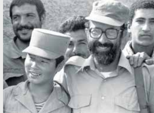
بازدید مصطفی چمران فرمانده جنگ‌های نامنظم از جبهه کرخه نور / / ۰۵-۰۲-۱۳۶۰