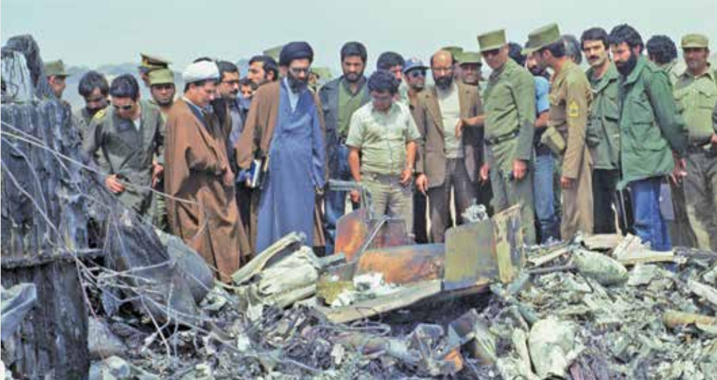
بازدید دکتر مصطفی چمران وزیر دفاع و آیت‌الله‌خامنه‌ای نماینده امام در شورای عالی دفاع و حجت‌الاسلام هاشمی رفسنجانی رئیس وقت مجلس از باقیمانده هواپیما و هلی‌کوپترهای آمریکایی در محرابی طبس / / ۲۰۰۵-۰۵-۱۳۶۰