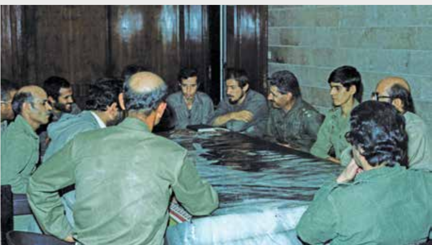
جلسه فرماندهان و طراحان پشت جبهه در خوزستان / / ۱۳-۰۲-۱۳۶۰