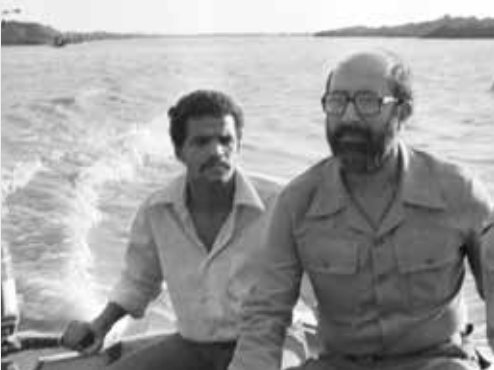
حضور دکتر چمران در مناطق جنگی / / ۱۴-۰۲-۱۳۶۰