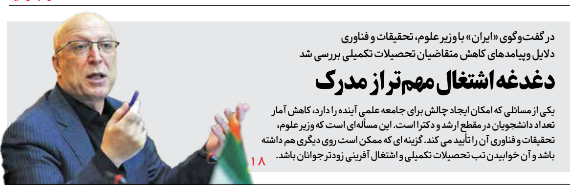
در گفت و گوی «ایران» با وزیر علوم، تحقیقات و فناوری دلایل و پیامدهای کاهش متقاضیان تحصیلات تکمیلی بررسی شد

مطالعات مختلف نشان داده یک دلار هزینه در بهداشت باعث صرفه جویی هفت دلاری در بخش درمان خواهد شد