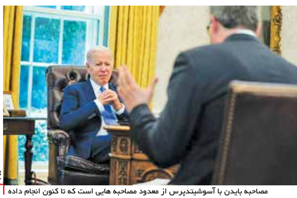
مصاحبه بایدن با آسوشیتدپرس از محدود مصاحبه‌هایی است که تا کنون انجام داده است.

می‌رسد، رئیس‌جمهور این کشور نیز در ناامیدی به سر می‌برد و این را می‌توان از جمله به جملہ سخنانش دریافت. او پیشتر نیز اعتراف کرده بود که تورم باعث شده است، بنیان خانواده‌های آمریکایی تضعیف شود و در جایی دیگر اذعان داشته بود توانایی مبارزه با مشکلات را ندارد و گفته بود که «این طور نیست که بتوانیم روی سوتیچی کلیک کنیم و قیمت بنزین پایین بیاید. چنین چیزی در کوتاه مدت نشدنی است.» او حتی در جایی دیگر پذیرفته بود که دولت اش نتوانسته بود، میزان گستردگی کمبود شیر خشک در آمریکا را پیش بینی کند و اعضای دولت او از جمله «جانت پلن»، وزیر خزانه‌داری اش اعتراف کرده بودند که انتظار نداشتند، تورم تا این حد بالا برود. مصاحبه اخیر بایدن نیز بیانی می‌تواند چشم‌انداز سیاسی دموکرات‌ها را چه در انتخابات میان‌دوره‌ای و چه انتخابات ریاست جمهوری ۲۰۲۴ تیره و تار کند.