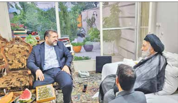
دیدار وزیر فرهنگ با آیت الله مستجابی

«مستجابی» از علمای برجسته اصفهان نیز رفت. اسماعیلی وزیر فرهنگ در این دیدار ضمن تبادل نظر در خصوص مسائل مختلف، حامل پیام محبت آمیز ریاست محترم جمهوری بود. آیت الله مستجابی در پاسخ به پیام آیت الله رئیسی نیز گفت: «باید همه برای موفقیت و سربلندی آقای رئیسی دعا کنند و بنده هم دعاگو هستم.»