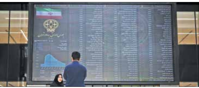
ارزش معاملات خرد (میلیارد تومان)

در جریان معاملات دیروز ارزش معاملات خرد بار دیگر نزولی شد و با کاهش ۱۳ درصدی به حدود ۵ هزار و ۲۱۰ میلیارد تومان رسید. ارزش معاملات خرد از ابتدای بهمن ماه سال ۱۴۰۰ و با شروع روند صعودی بازار شروع به افزایش کرده بود. این روند تا رسیدن شاخص به عدد یک میلیون و ۶۰۷ هزار واحد همچنان ادامه داشت تا از این زمان روند نزولی را در پی گیرد. هم‌اکنون شاخص ارزش معاملات خرد در ۶۰ روز گذشته حدود ۳۰۰ هزار و ۳۰۰ میلیارد و میانگین ۹۰ روز این معاملات در حدود ۴۰۰ هزار و ۸۰۰ میلیارد تومان تقاضای برای بنزین، دیزل و سوخت هواپیما در