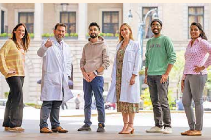
برخی از اعضای تیم تحقیقاتی به همراه چندتن از بیماران بهبود یافته

وقتی این سیستم کار نمی‌کند منجر به ایجاد خطاهای بیشتری در پروتئین‌ها می‌شود پس از آن سیستم ایمنی این خطاها را تشخیص می‌دهد و سلول‌های سرطانی را می‌کشد. آگوس گفت: جالب است که هر بیمار در یک کارآزمایی بالینی به یک دارو پاسخ دهد تقریباً ناشناخته است و این نقش پزشکی شخص (پزشکی شخصی سازی شده موضوع جدیدی در صنعت پزشکی و بهداشت است. هیچ تعریف عمومی پذیرفته شده‌ای از اصطلاح «پزشکی شخصی» وجود ندارد. به زبان ساده، پزشکی