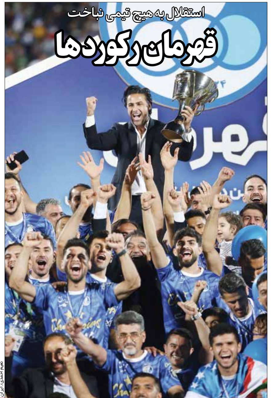
معم احمدی / ایران

هشتمین روز عملیات آواربرداری از ساختمان فروریخته متروپل آبادان در حالی ادامه دارد که مردم همچنان پایه پای خانواده‌های مصیبت دیده و امدادگران در تلاش برای یافتن ناپدیدشدگان هستند. دیروز ۳ جسد از زیر آوار بیرون کشیده شد.