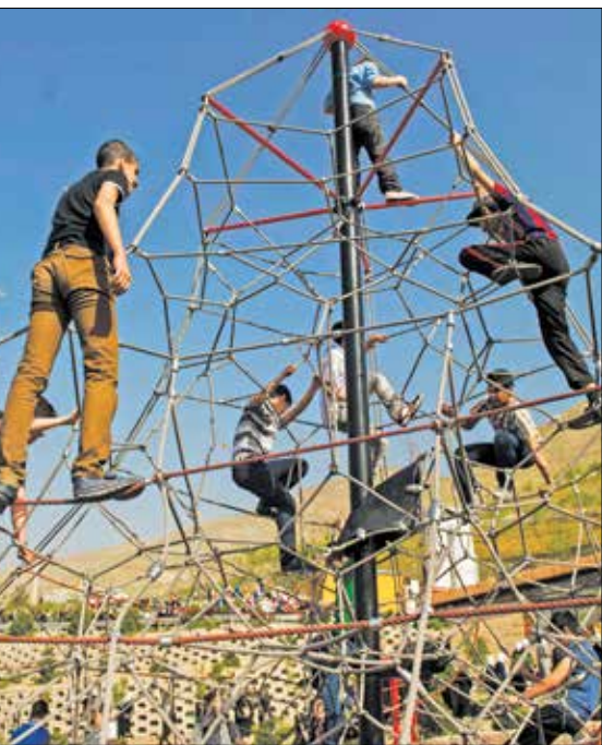
سیدنا صفوری / ایران

از این کلاس‌ها طبق درخواست پدر و مادر است و خود بچه هم لزوماً به آن علاقه‌ای ندارد. بیشتر وقت‌ها این مسأله مربوط به خرده فرهنگ‌های ما است و چشم و هم‌چشمی‌هایی که بین خانواده‌ها وجود دارد. خود بچه‌ها این‌طور نیستند و دل‌شان می‌خواهد در اوقات فراغت زمان خوشی را با دوستان‌شان سپری کنند و همان آموزشی که به این صورت می‌بینند هم برایشان لذتبخش است و باعث ایجاد نشاط و شادابی در آنها می‌شود. مثلاً پسر من وقتی کلاس فوتبال می‌رود علاوه بر اینکه آموزش می‌بیند، فعالیت بدنی می‌کند و انرژی‌اش تخلیه می‌شود و می‌تواند در سال تحصیلی جدید با توان و انرژی بیشتری تحصیل را شروع کند.»