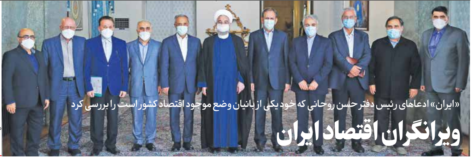
«ایران» ادعاهای رئیس دفتر حسن روحانی که خود یکی از بنیان وضع موجود اقتصاد کشور است را بررسی کرد