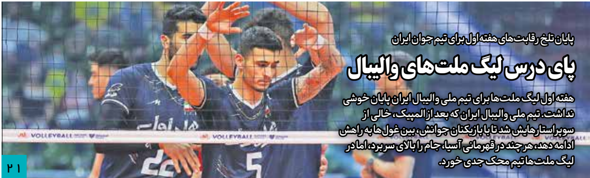
پایان تلخ رقابت‌های هفته‌اول برای تیم جوان ایران