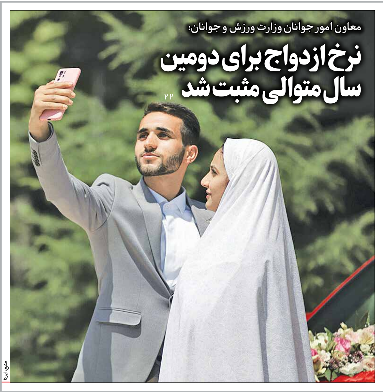
معاون امور جوانان وزارت ورزش و جوانان:

رئیس کارگروه رفاه و تأمین اجتماعی کمیسیون علمی، فرهنگی و اجتماعی مجمع تشخیص مصلحت نظام با اشاره به گزارشات و پایش‌های موجود در حوزه حمایت از اقشار کم‌برخوردار گفت: طبق پایش‌های موجود، تنها ۲۰ درصد افرادی که از کمیته امداد و بهزیستی خدمات می‌گیرند متعلق به دهک‌های یک تا سه هستند و ۸۰ درصد این افراد متعلق به دهک ۴ به بالا هستند، چراکه تاکنون در نظام حمایتی، حمایت مبتنی بر تقاضا را از افراد انجام داده‌ایم.