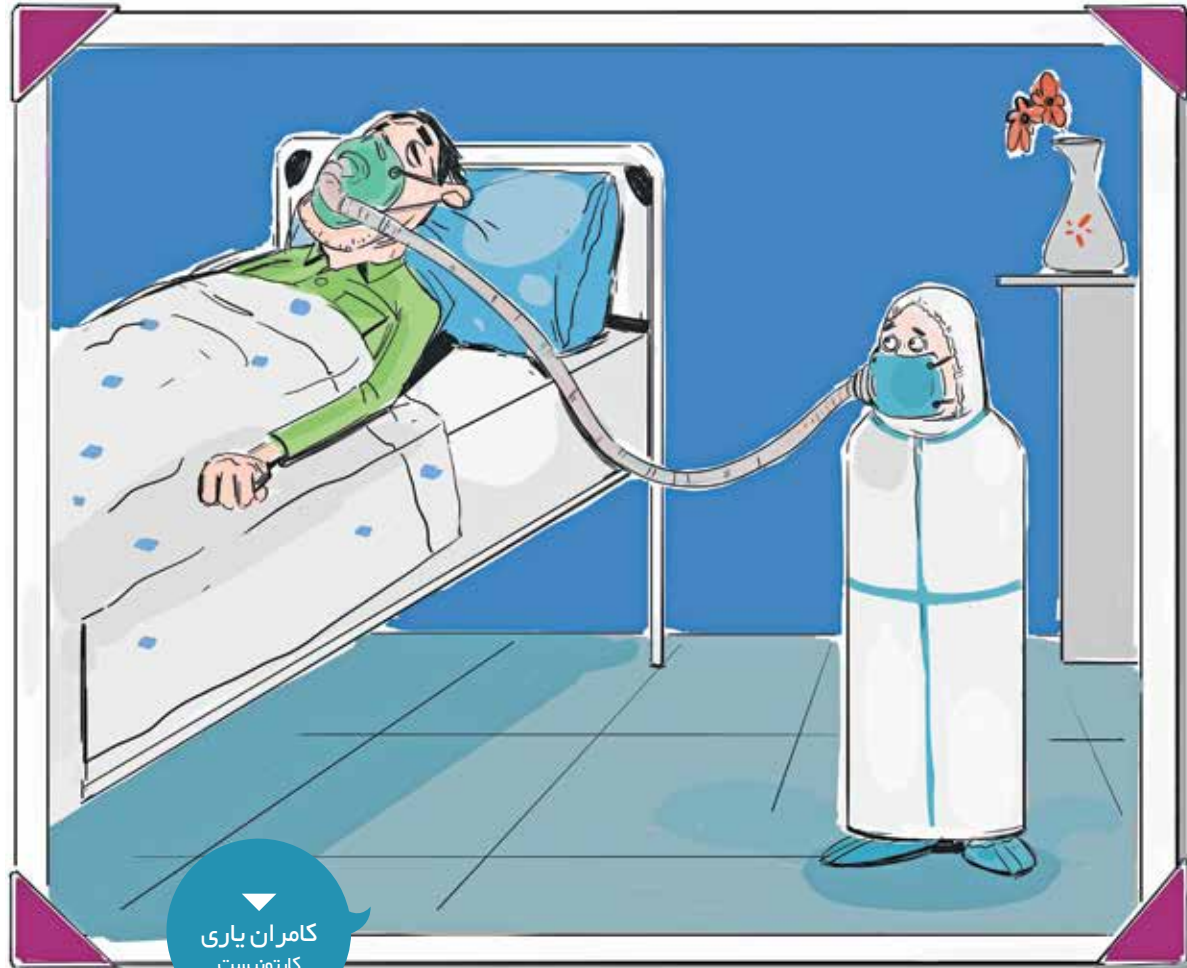
کامران پاری کارتونیست