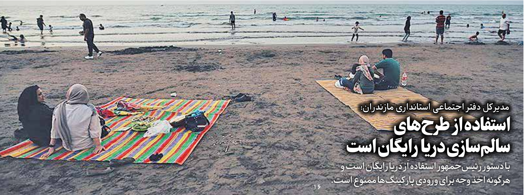
مدیرکل دفتر اجتماعی استاندار مازندران: استفاده از طرح های سالم سازی دریا رایگان است با دستور رئیس جمهور استفاده از دریا رایگان است و هر گونه اخذ وجه برای ورودی پارکینگ ها ممنوع است.