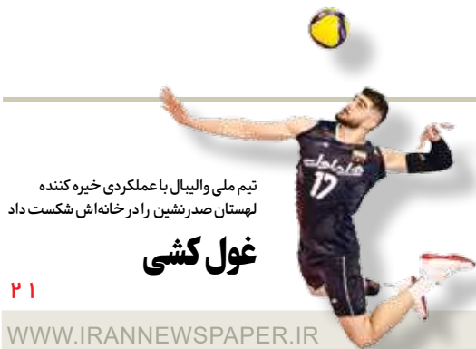
تیم ملی والیبال با عملکردی خیره کننده لهستان صدرنشین رادر خانه اش شکست داد