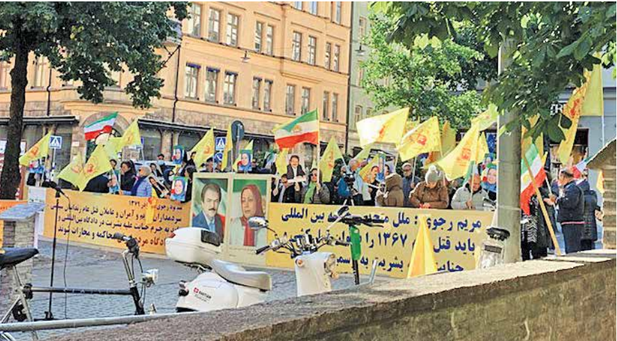
تجمع منافقین در حمایت از دادگاه ناعادلانه حمید نوری در استکهلم

به اینکه سوئد ابتدا نوری را بر مبنای یک‌سری اتهامات واهی دستگیر کرد و بعد از آن به سراغ این رفت تا بتواند یک‌سری مستندات ساختگی را فراهم و کيفرخواستی را برای ایشان تنظیم و به دادگاه ارسال کند، نسبت به شرایط زندان برای این شهروند ایرانی اعتراض کرده و گفته بود: «به نوری برای مدت یک سال و نیم اجازه