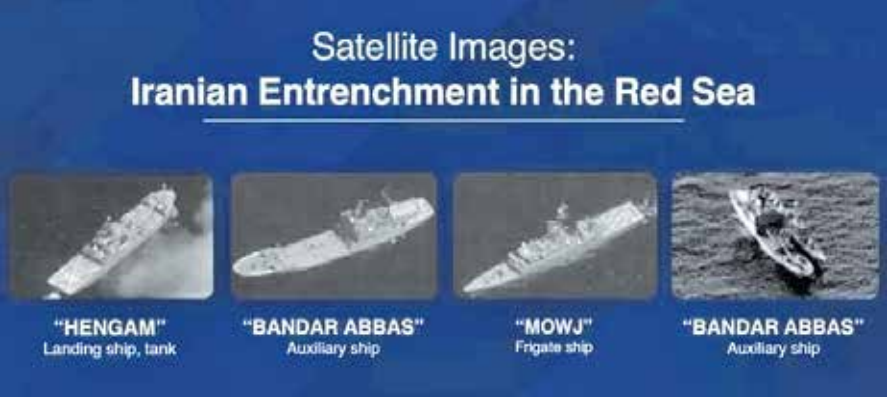
تصاویر ماهواره‌ای که وزیر دفاع اسرائیل از ناوچه‌های ایران در دریای سرخ ارائه داد