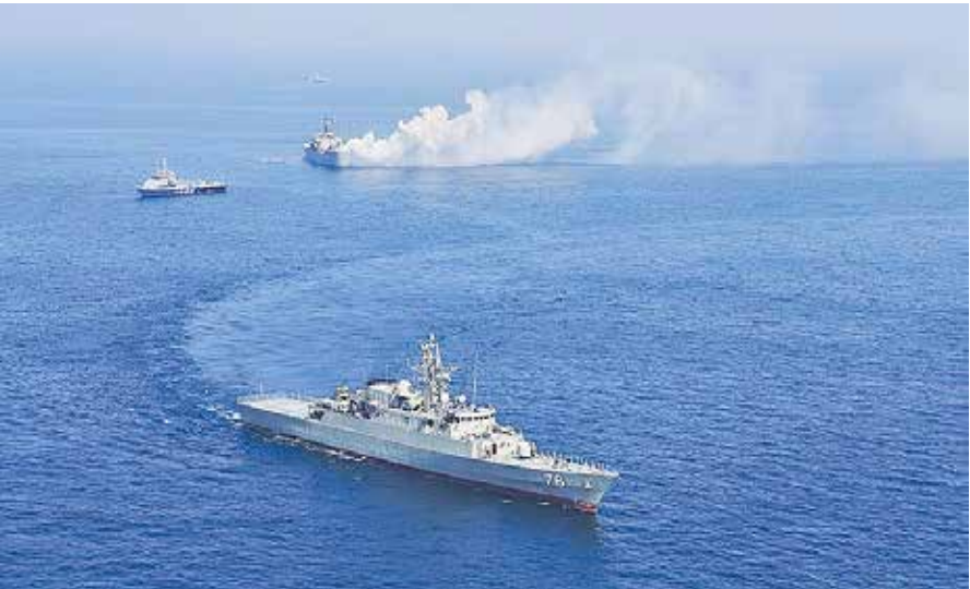
رزمایش مشترک ایران، روسیه و چین در شمال اقیانوس هند بهمن ۱۴۰۰

حال ایران به پشتوانه قدرت دریایی خود، در روند صادرات نفت به سوریه نیز بارها قدرت خود را به نمایش گذاشت و هر بار نقل‌های بی‌هوده برای جلوگیری از این روند از طریق توقیف نفتکش‌های حامل نفت صادراتی ایران با ظهور همین قدرت به شکست انجامید. چنان‌که در هفته‌های گذشته باوقیف نفتکش ایرانی توسط یونانی‌ها بلافاصله با توقیف دو نفتکش این کشور در خلیج فارس و دریای عمان پاسخ داده شد و یونانی‌ها را به صدور حکم لغو توقیف نفتکش ایران ناچار ساخت و بار دیگر شکستی بزرگ‌تر ایران در حال ایجاد و تثبیت جای پای صهیونیست‌هاورد ساخت.