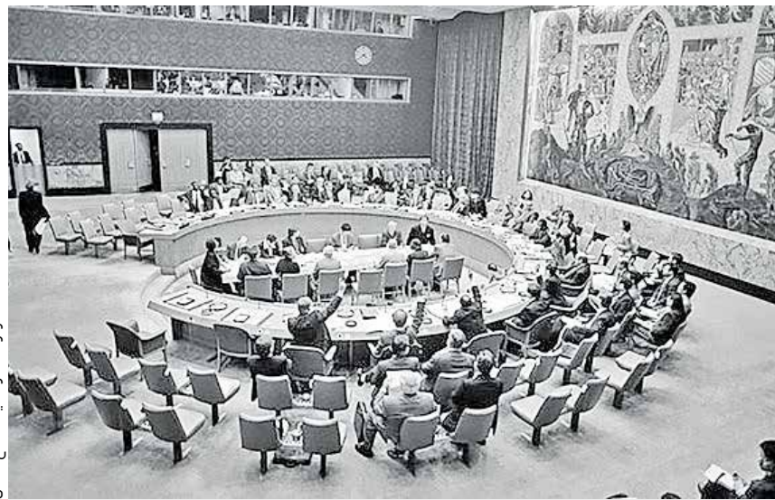
مرکز اسناد و تحقیقات دفاع مقدس