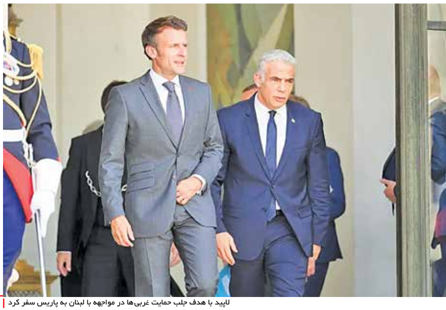
لایید با هدف جلب حمایت غربی‌ها در مواجهه با لبنان به پاریس سفر کرد

پارلمان را داده است. او سپس اذعان داشت، هنگامی قن به «بنیجر» سمت دارایی و «ساجد جاوید»، وزیر بهداشت، اما دو استعفایی که صبح چهارشنبه شمار آنها با استعفا ی «ویل کوپلنس»، وزیر امور کودکان و خانواده به عدد ۳ رسید و البته به دنبال هر یک از این استعفا، مشاوران و دستیاران هر کدام از این وزرا نیز کناره‌گیری خود را از سمت‌شان اعلام کردند. «ریشی سوناگ» در استعفا ی خود به طور لوییچی دولت «جانسون» را متهم به بی‌صداقتی کرد و نوشت: «مردم حق دارند از دولت انتظار صداقت داشته باشند.» «ساجد جاوید» هم در استعفا نامه خود نوشت، رهبری حزب در راستای «منافع ملی» عمل نمی‌کند و بنابراین ترجیح داده است استعفا کند. علاوه بر این استعفا، عصر سه‌شنبه نیز «بیم افولامی»، نایب رئیس حزب محافظه‌کار استعفا ی خود را از این سمت اعلام کرد. این استعفا‌ها ساعتی پس از آن رخ داد که نخست‌وزیر انگلیس در مصاحبه‌ای در شبکه تلویزیونی «بی بی سی» تأکید کرد، اشتباه کرده که به «گریس بنیجر»، سمت معاونت رئیس حزب محافظه‌کار و مسئولیت نظارت بر عملکرد نمایندگان محافظه‌کار در