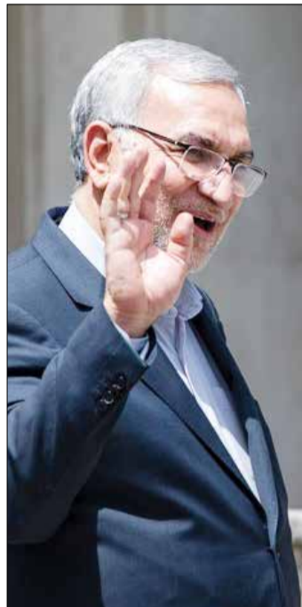
وزیر بهداشت، درمان و آموزش پزشکی:

همه افراد بالای ۱۲ سال واکسن یاد آور تزریق کنند