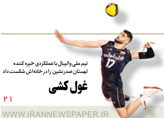
تیم ملی والیبال با عملکردی خیره کننده لهستان صدرنشین رادر خانه اش شکست داد