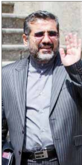
وزیر فرهنگ و ارشاد اسلامی:

برنامه های هنری سعدآباد دیگر تعطیل نمی شود