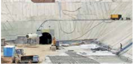
پروژه غیر قانونی انتقال آب سبزوکه به چغاخور