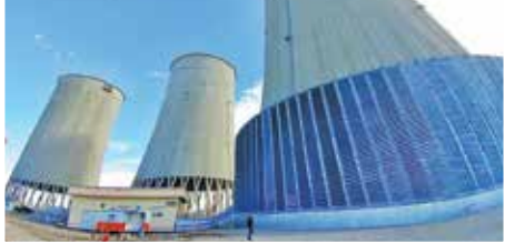
نیروگاه بدون مجوز زیست‌محیطی سیکل ترکیبی سیلان