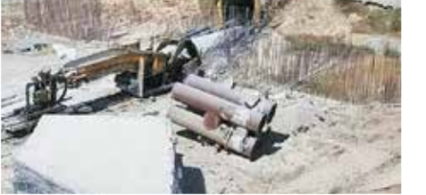
تونل بدون مجوز انتقال آب بهشت آباد