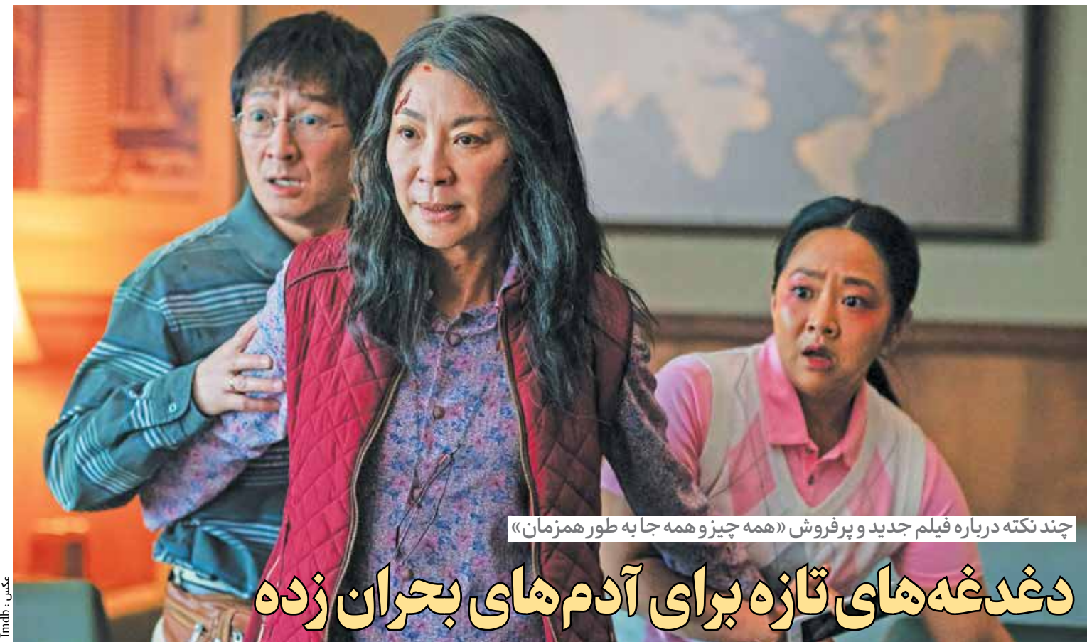
چند نکته درباره فیلم جدید و پر فروش «همه چیز و همه جا به طور همزمان»

مشایخی در ادامه به تشریح جایگاه موسیقی و متن در موسیقی اروپا پرداخت و گفت: کلودیو مونتوره‌وردی برای اولین بار با متن ادبی شعری معاصر خودش در موسیقی کار کرد که مخاطب آن را نمی‌شناخت. بعدها موسیقی چندصدایی شد و این چندصدایی ریتم‌های مختلف را با وجود آورد. مونتوره‌وردی از اولین کسانی بود که سعی کرد موسیقی ریتم متن باشد یعنی اگر سخن از لیخند است این لیخند با موسیقی نشان داده شود تا به گوش برسد. او گفت: ۱۵ سال بعد از انقلاب فرانسه پیشنهادی به بنهون برای نگارش متن جدید داده شد چراکه انقلاب فرانسه باعث ایجاد یک طبقه جدید اجتماعی شده بود که نوکسبه بودند. این نوکسبه‌ها پول و تجملات داشتند، اما تحمل روشی نداشتند لذا فلسفه زبان به آنها آموخته می‌شد. بنهون پیشنهاد ساخت فیگور با متن‌های جدید را برای زندگی روستایی و زندگی در طبیعت و... مطرح کرد. این آهنگساز و رهبر ارکستر با تأکید بر اینکه در اروپا هنوز تدریس موسیقی علت و معلولی است، ضروری پیوسته فزونی می‌گیرد.