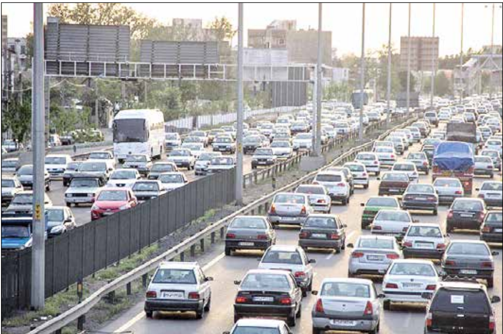
ایران واشقانی خبرنگار

گره کور ترافیک در پل فردیس سال‌هاست هزینه، زمان و آرامش مردمی را که قصد عبور از این مسیر پرتدد دارند زیر چرخ‌های خودروهای عبوری له کرده است. معضل فرساینده‌ای که بدون دلیل و توجیه، روزانه میلیون‌ها تومان سرمایه‌های مادی و معنوی البرز نشینان و خودروهای عبوری به ۱۴ استان دیگر را تلف کرده و استهلاک خودرو، هدر رفت سوخت و آلودگی محیط را در کنار اتلاف عمر و از بین رفتن سلامت جسمی، روحی، روانی مسافران رقم می‌زند. با وجود آنکه پل فردیس در محدوده شهر کرج واقع شده، اما قفل شدن ترافیک اتوبان تهران - قزوین به عنوان شریان اصلی مواصلاتی غرب و شرق کشور مساله‌ای ملی است که استهلاک هنگفت سرمایه و زمان، از پیامدهای زیانبار آن است.