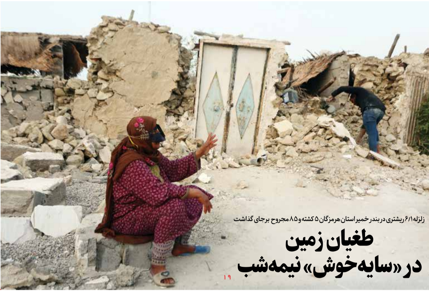
زلزله ۶/۱ ریشتری در بندر خمیر استان هرمزگان ۵ کشته و ۸۵ مجروح برجای گذاشت