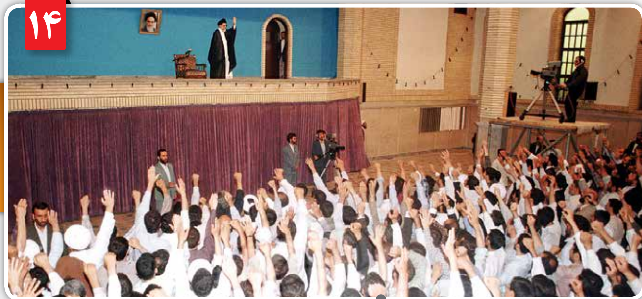
مقام معظم رهبری در دیداری، بشدت حادثه کوی دانشگاه را محکوم کردند و اظهار داشتند که این حادثه تلخ، قلب مرا جریحه‌دار کرده است. ایشان همچنین فرمودند: ما در راه خدا تا آخرین نفس ایستاده‌ایم