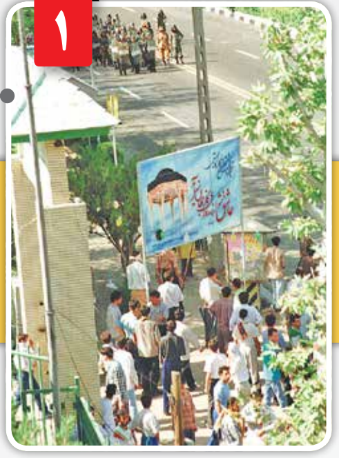
درگیری جمعی از دانشجویان و نیروی انتظامی از شامگاه ۱۷ تیر شروع شد