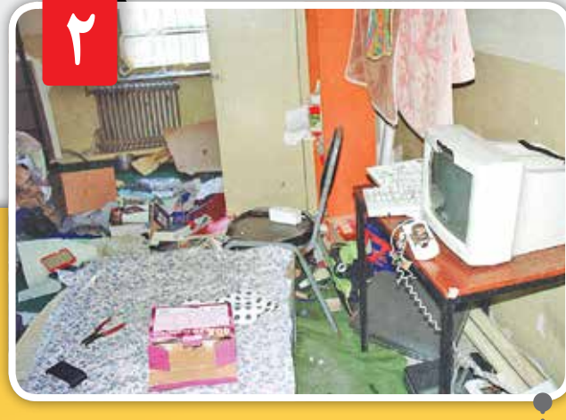
حجم تخریب‌ها در درگیری سحرگاه ۱۸ تیر زیاد بود