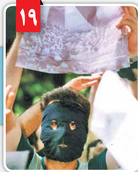
برخی افراد حاضر شباهتی به دانشجویان نداشتند