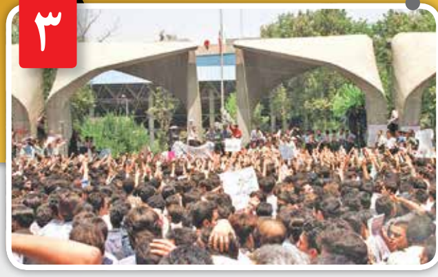
معترضین در روزهای بعد خیابان‌های مرکزی تهران را اشغال کرده بودند