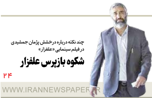
چند نکته درباره درخشش پژمان جمشیدی در فیلم سینمایی «علفزار»