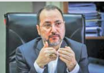
دکتر مرتضی اردبیلی

دولت و ملت در برابر بیگانه باید قوی باشند). این همان چیزی است که رهبر معظم انقلاب با تعبیر «مقتدر مظلوم» از آن یاد کردند؛ به این معنی که سیاست‌سوم این است که ما چه فهمی از مخاطب و مطلب سوم این است که ما چه فهمی از مخاطب و تنوع مخاطبان داریم و برای اجرای سیاست‌ها برای این مخاطبان متنوع چه فکری کرده‌ایم؟ مطلب چهارم این است که چه فهمی از حجاب داریم؟ درباره اینکه «چه باید کرد؟» ذکر دو نکته را لازم می‌بینم؛ نخست اینکه، کلیت برنامه‌ها باید بر این اصل استوار باشد که بی‌حجابی هزینه داشته باشد. امروزه وضعیت به گونه‌ای شده که بی‌حجابی هزینه فرهنگی و اجتماعی و اقتصادی ندارد؛ اما حجاب هزینه‌دار شده است؛ در حالی که باید بالعکس باشد. دومین نکته این است که حکومت باید از مداخله‌های مستقیم کنار بکشد و غیرمستقیم مداخله کند. همین مثال ایجاد هزینه برای بی‌حجابی و کم کردن هزینه برای احجاب‌ها نمونه‌ای از اقدامات غیرمستقیم است که در وراج فرهنگ حجاب و عفاف اثرش بسیار بیشتر از مداخلات مستقیم حکومت خواهد بود.