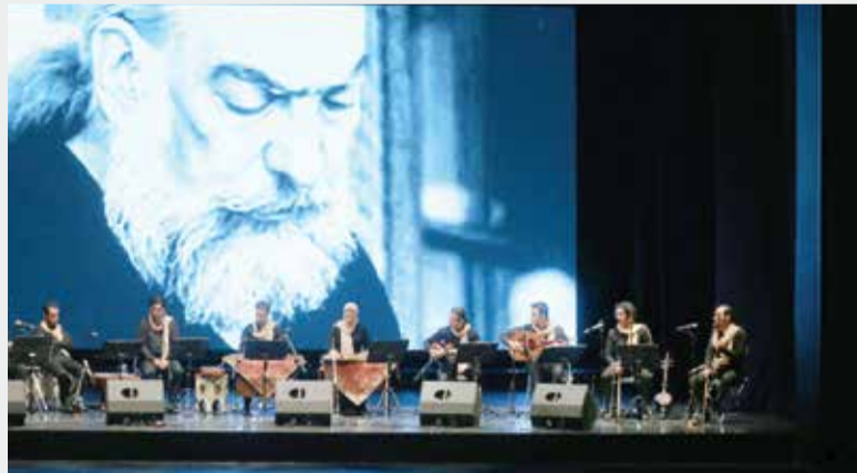
اجرای ارکستر سازه‌های ایرانی در بنیاد رودکی