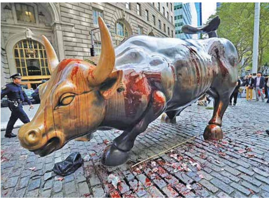
مجسمه «چارچینگ بول» یا گاو پولساز ملقب به «گاو وال استریتی» در منطقه اقتصادی منهتن (نیویورک)

مشکلات می‌شود کارگر است. چرا که در دوره رونق به دلیل افزایش قیمت‌ها و ثابت بودن دستمزدها، کارگران عمدتاً با کاهش قدرت خرید مواجه می‌شوند و در دوره رکود نیز تعدیل نیرو، پرداخت نشدن دستمزدها و کاهش مسائل رفاهی از مهم‌ترین معضلات آنها است. نابرابری‌ها در نظام سرمایه‌داری به قدری گسترده بوده که منجر به شکل‌گیری نظریه‌های افراطی‌ای مانند مارکسیسم شده و کارگران را بر آن داشته تا از نظام سرمایه‌داری گریزان شده و به نظام سوسیالیسم پناه آورند. وقتی نارسایی‌های آن را دیدند، ترجیح دادند در همان نابرابری سرمایه‌داری زندگی کنند. این معضل در نظام سرمایه‌داری ریشه دوانده و ساختار این نظام جز در صورت تعدیل‌های جدی امکان از بین بردن آن را نمی‌دهد. روند ۵۰ ساله اقتصاد آمریکا در رشد نابرابری بر اساس ضریب جینی نشان می‌دهد که ضریب جینی طی سال‌های اخیر به مرز ۰.۴۸ رسیده که عدد بزرگی است و آمریکا را در میان کشورهای با بیشترین سطح نابرابری در دنیا قرار داده است. این روند نابرابری رو به افزایش است. گزارش مؤسسه اعتبارسنجی مودیز (Moody's) بیانگر آن است که طی دو دهه اخیر، نابرابری ثروت و درآمد در آمریکا افزایش یافته است؛ چون افراد دارای درآمد بالا و بسیار بالا توانستند سهم بیشتری از درآمد ثروت را به خود اختصاص دهند. بر این اساس، یک دهک بالای درآمدی جامعه آمریکایی از سال ۱۹۹۵ تاکنون توانستند در حدود ۲۰۰ درصد بر دارایی خالص خود بیفزایند. در حالی که چهار خود پایینی درآمدی طی همین مدت، شاهد سقوط میانگین دارایی‌هایشان بوده‌اند. ■ خلاصه‌اقتصاد جایگزین و آینده پیش رو از آنجا که سیستم اقتصادی آمریکا تمایل زیادی به حفظ سرمایه‌داری