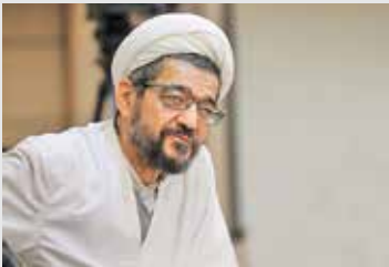
دکتر مرتضی اردبیلی

از این رو، اکنون با استدلال و دلایل بسیار می‌توان پیرامون این بحث سخن گفت و گفتمان رقیب قدرتمندی که بخواهد مقابل این گفتمان بایستد و پاسخی به آن داشته باشد، وجود ندارد. اگر در گذشته بی‌حجابی می‌توانست در همه عرصه‌ها بویژه محافل علمی عرض اندام کند و خود را جابیندازد، به این خاطر بود که گفتمان حجاب هنوز به خوبی شکل نگرفته بود؛ اما امروزه این گفتمان بدرستی شکل یافته است و رقیب در حال عقب‌نشینی است. اتفاق بسیار جالبی که در این قضیه افتاده است جدا شدن صف متحجران از گفتمان حجاب است. پیش‌تر جماعت متحجران دیندار، خود را در صف مذهبیون جا داده بودند، اما بعد از انقلاب وقتی گفتمان حجاب شکل گرفت یکی از اتفاقات بزرگ