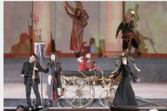
اجرای کنسرت نمایش سی‌صد در مجوه کاخ سعدآباد