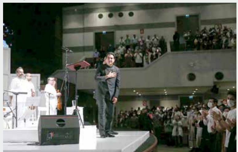
استقبال بی‌نظیر مردم از کنسرت همایون شجریان