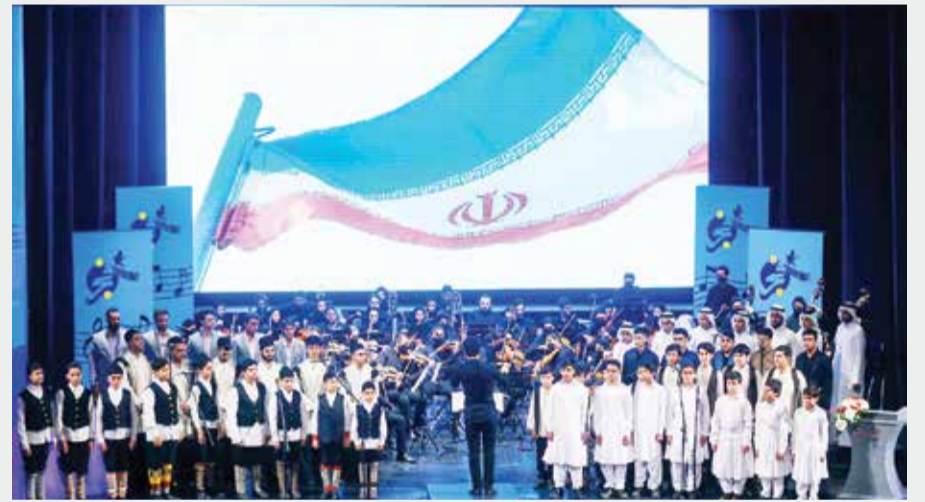
آیین اختتامیه نخستین جشنواره ملی و بین‌المللی سرود فجر