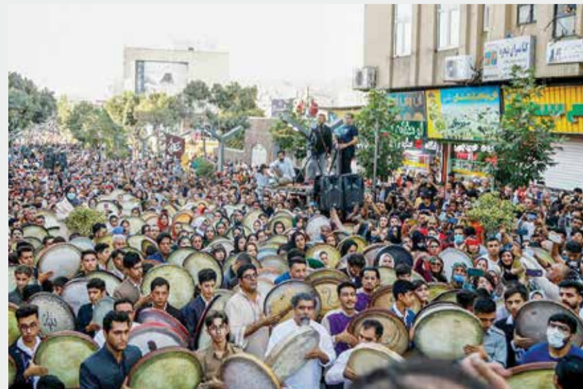
دهمین دوره جشنواره بین‌المللی دف نوازی رحمت در سنندج