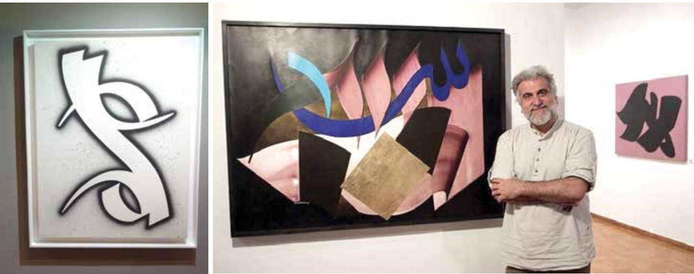
پنجاه شهری، تابلوی خامس آنتالین

پوریا تریابی / نخستین نمایشگاه گروهی «موزیکال‌گرافی»، همراه پرفورمنس و موسیقی و کارگاه هنری زیر نظر بهمن پناهی در مؤسسه فرهنگی هنری ۲۵ تیرماه آغاز به کار کرد. در این نمایشگاه آثاری از استاد بهمن پناهی به همراه بیش از ۵۰ اثر برگزیده از هنرآموزگاران مکتب هنری «موزیکال‌گرافی» از سراسر کشور به نمایش گذاشته شده است. بهمن پناهی که خود مبدع مکتب هنری در عرصه خط و خوشنویسی معاصر و مدرس هنر در فرانسه است، سرپرستی این گروه را برعهده دارد و در یک دوره آموزشی مستمر از راه دور موفق شده آموزه‌های مکتب هنری «موزیکال‌گرافی» را با دو رویکرد «مفهومی» و «حرکتی» به هنرجویانش بیاموزد. گفت‌وگوی حاضر با پناهی درباره مکتب موزیکال‌گرافی و این نمایشگاه است که با هم می‌خوانیم.