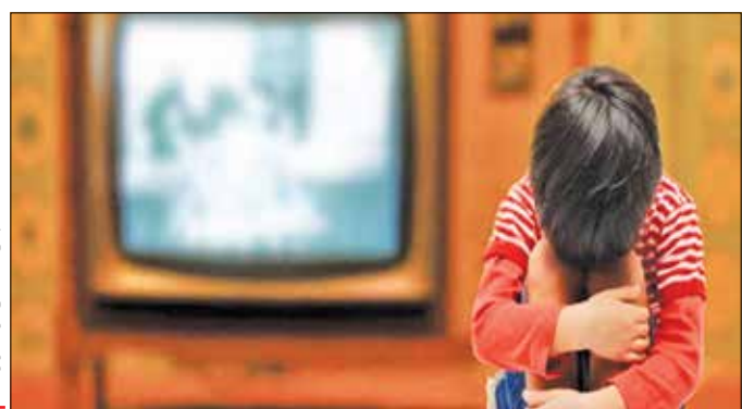
انجمن تخصصی کودک و رسانه

اسکندری گفت: در واقع هر چیزی که از حد اعتدال خود بگذرد، ایجاد آسیب می‌کند. رژیم مصرف رسانه هم اگر تبدیل به پرخوری رسانه‌ای شود، ممکن است به اعتیاد رسانه‌ای