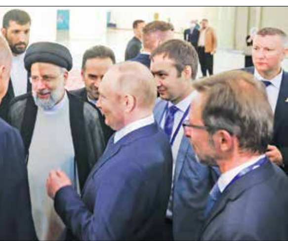
رئیس‌جمهوری ایران، سید ابراهیم رئیسی، با وزیر امور خارجه آمریکا، آنتونی بلینکن، در جریان دیدار در تهران.

مهمتر از این حاشیه‌ها سخنانی بود که احتمالاً این نشست برای گفته شدن آن طراحی و برنامه‌ریزی شده بود. حسن روحانی در این دیدار که در دفتر جدید خود برگزار کرده بود، مدعی شد: «پس از انقلاب، کشور با مشکلات زیادی روبه‌رو