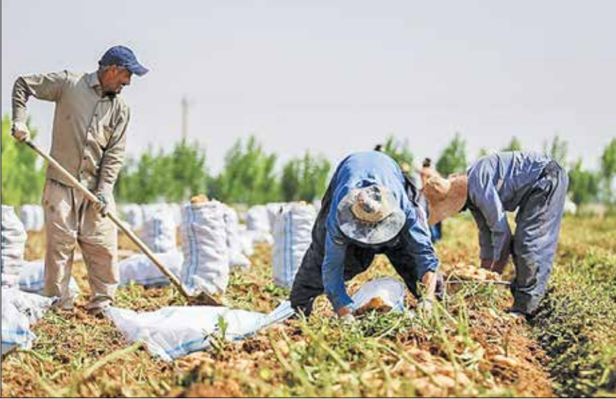
نایب رئیس انجمن برنج

سروی گفت: اجرا نشدن این طرح طی سالیان اخیر سبب شد در برخی از سال‌ها با فراوانی محصولاتی از جمله سیب‌زمینی و گوجه‌فرنگی