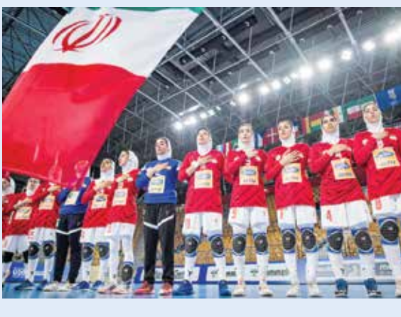
لیوریول مقتدرانه فاتح سوپر جام انگلیس شد

پرساغفاری/ نهمین دوره مسابقات هندبال قهرمانی نوجوانان دختر جهان در اسکوپیة مقدونیه شمالی با برد تاریخی هندبالبست‌های کشورمان استارت خورد. نوجوانان هندبالبست که نخستین تجربه جهانی خود را پشت سرمی گذارند، در بازی اول برابر ازبکستان قرار گرفتند و با نتیجه پرگل ۴۲-۳۱ به برتری رسیدند. آنها تنها در تاریخ ورزش ایران اولین برد ارزشمند هندبال در این رده سنی را کسب کردند بلکه توانستند در مسابقات جهانی بهترین بازی را در میان بازی‌های روز اول ثبت کنند. همچنین تنها تیمی که بیش از ۲۰ گل در این روز