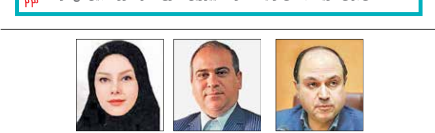
«ایران» در گفت‌وگو با کارشناسان از اهمیت توجه به فشار روانی شغلی و تأثیرات آن بر آشفته‌گی‌های درون خانوادگی گزارش می‌دهد

وزیر فرهنگ و ارشاد اسلامی: با حمایت از استعداد های جوان و استفاده از ظرفیت عظیم آنان برای تقویت بخش تولید محتوا، تغییر ریل گذاری تئاتر کشور تسهیل می شود