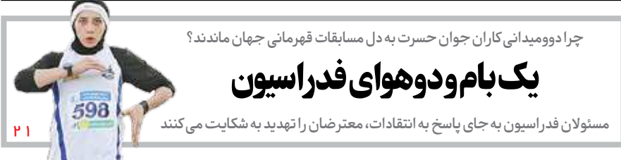
چرا دوومیدانی کاران جوان حسرت به دل مسابقات قهرمانی جهان ماندند؟