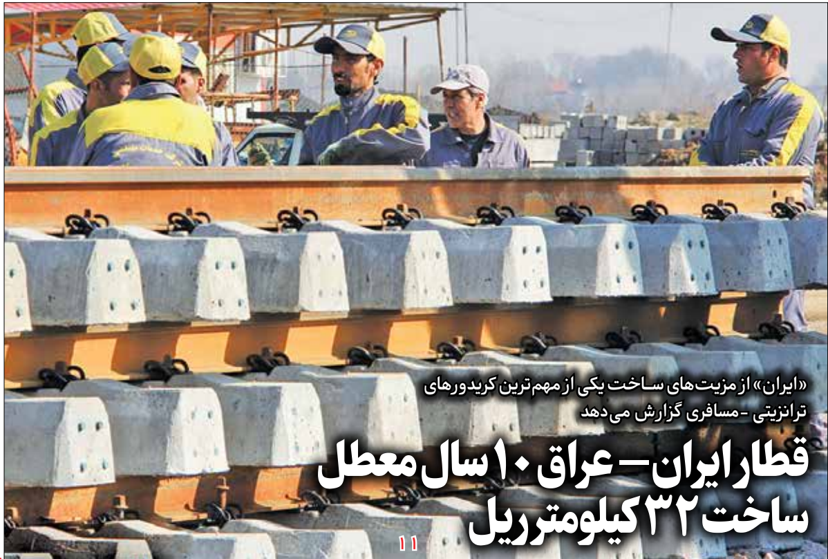
«ایران» از مزیت‌های ساخت یکی از مهم‌ترین کریدورهای ترانزیتی - مسافری گزارش می‌دهد