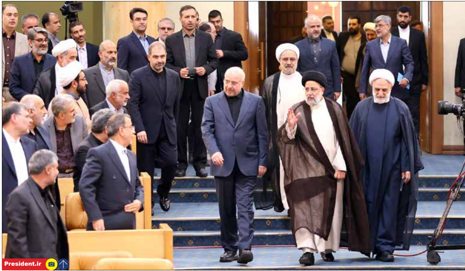
همایش سالانه قوه قضائیه با حضور رؤسای سه قوه و مقامات دستگاه ها برگزار شد