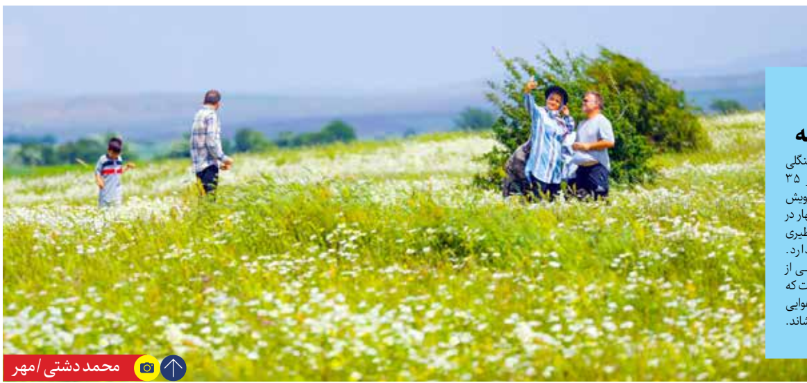
محمد دشتی / امهر

رئیس جمهور در گفت و گو با پوتین: کریدور شمال - جنوب نمونه موفق برای تعامل تهران - مسکو است