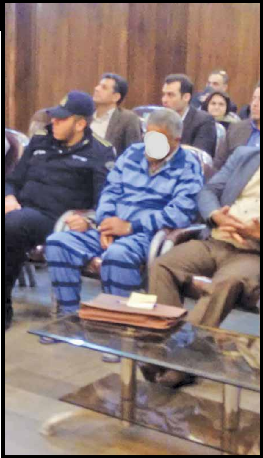
سر نوشت عجیب دختری با عشق مجازی