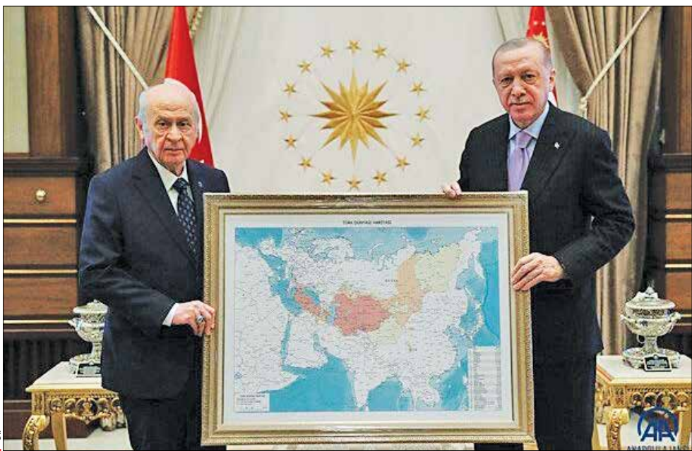
دولت پاتنجه لی رهبر حزب حرکت ملی ترکیه در اقدامی جنجالی نقشه «جهان ترک» را به اردوغان هدیه داد.

حالا و پس از فروکش کردن جنگ در سوریه، ترکیه بار دیگر تصمیم گرفته منطقه امنی به طول ۳۰ کیلومتر در مرزهایش با سوریه ایجاد کند. ترکیه با همکاری ارتش آزاد سوریه - شورشیان علیه حکومت بشار که مورد حمایت ترکیه بودند - خود را آماده چهارمین عملیات در خاک مرزی سوریه می‌کند. برانگیختن حس ملی‌گرایی