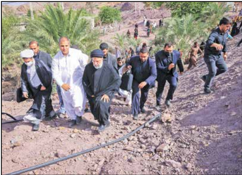
حضور رئیس جمهور در روستای تنگ شاه عنبر آباد