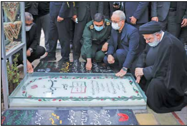
زیارت گلزار شهدای کرمان و مزار سردار قاسم سلیمانی