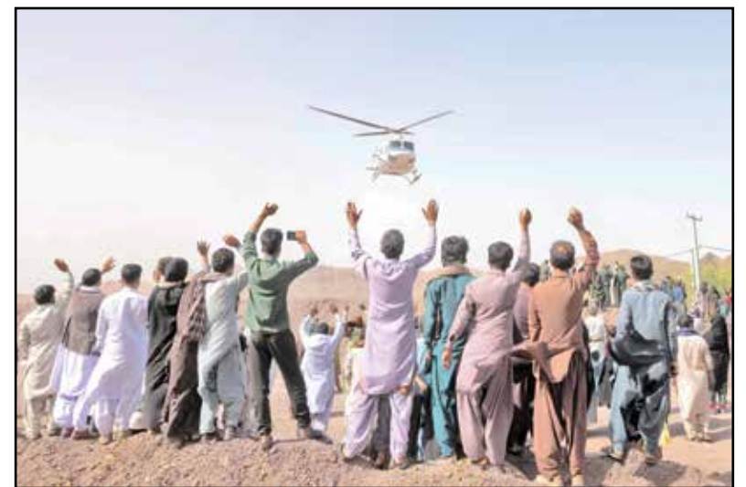
بدرقه اهالی روستای تنگ شاه عنبر آباد از رئیس جمهور