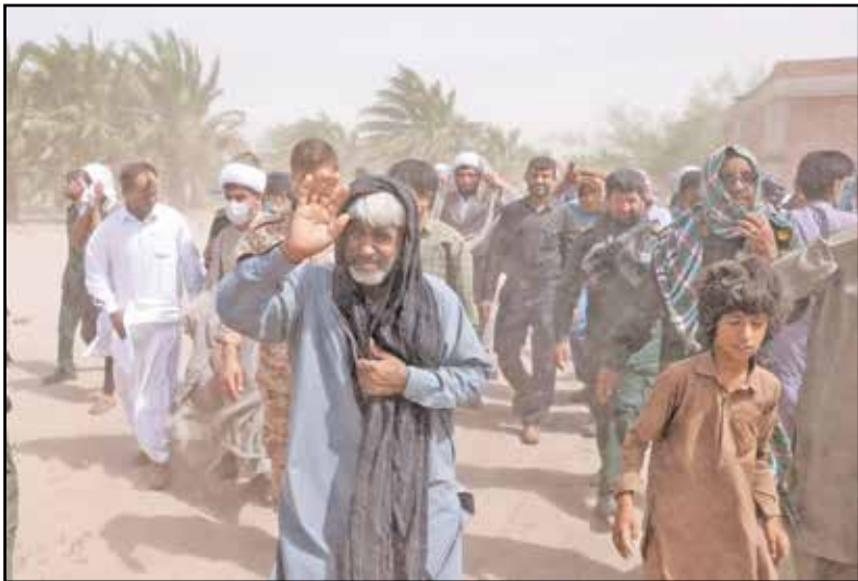
در حاشیه حضور آیت‌الله‌نقیسی در جمع مردم روستای کروجان جازموریان