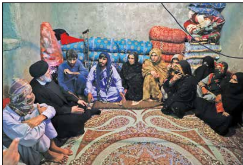
حضور آیت‌الله‌نقیسی در منزل یکی از اهالی روستای کروجان جازموریان