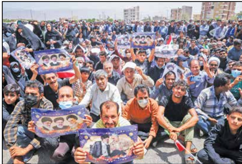
دیدار با اقشار مختلف مردم جیرفت