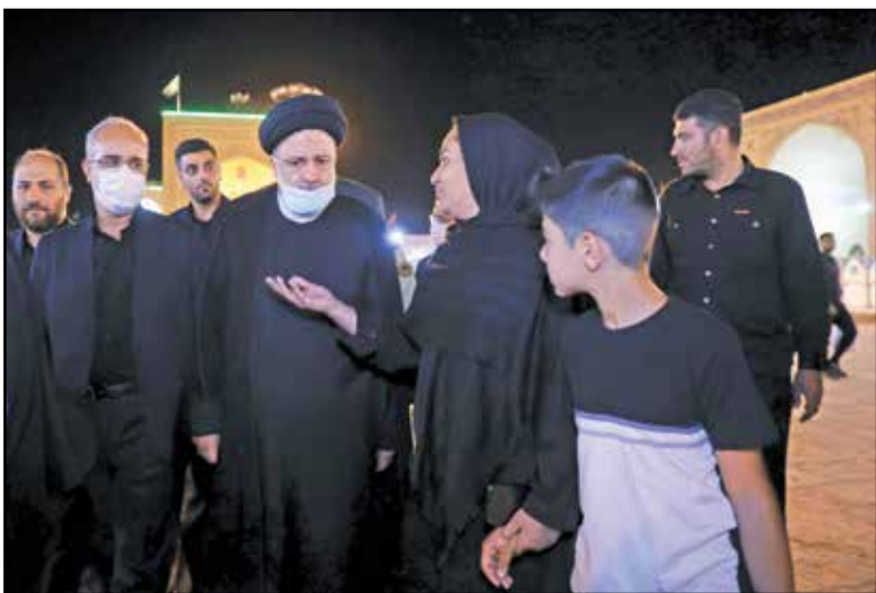
دیدار رئیس جمهور در میان نمازگزاران مسجد تاریخی امام خمینی (ره) کرمان