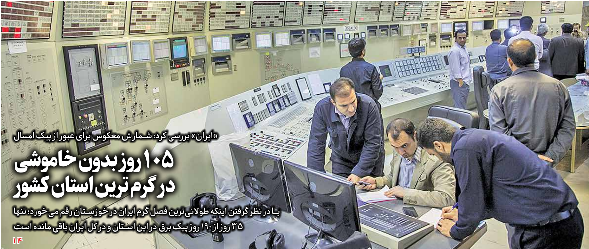
«ایران» بررسی کرده: شمارش معکوس برای عبور از پیک امسال

گروه اقتصادی / در طول یکسال اخیر و از زمان آغاز به کار دولت سیزدهم و در شرایطی که همچنان آشدت تحریم‌ها علیه ایران کاسته نشده، اغلب شاخص‌های کلان اقتصاد ایران روند روبه‌رشدی را تجربه کرده است. موضوعی که نهادهای رسمی