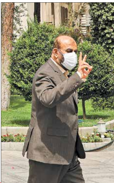
عکس: شاه - علیرضا موت‌انگیز/ایران

وی تأکید کرد: موزه‌ها باید در سطح کشور فعال باشند و اشیای تاریخی به جای نگهداری در مخزن، در موزه نگه داشته شوند تا مردم آنها را ببینند. وزیر گردشگری درباره سرعت پرتره مظفرالدین شاه از کاخ موزه گلستان گفت: