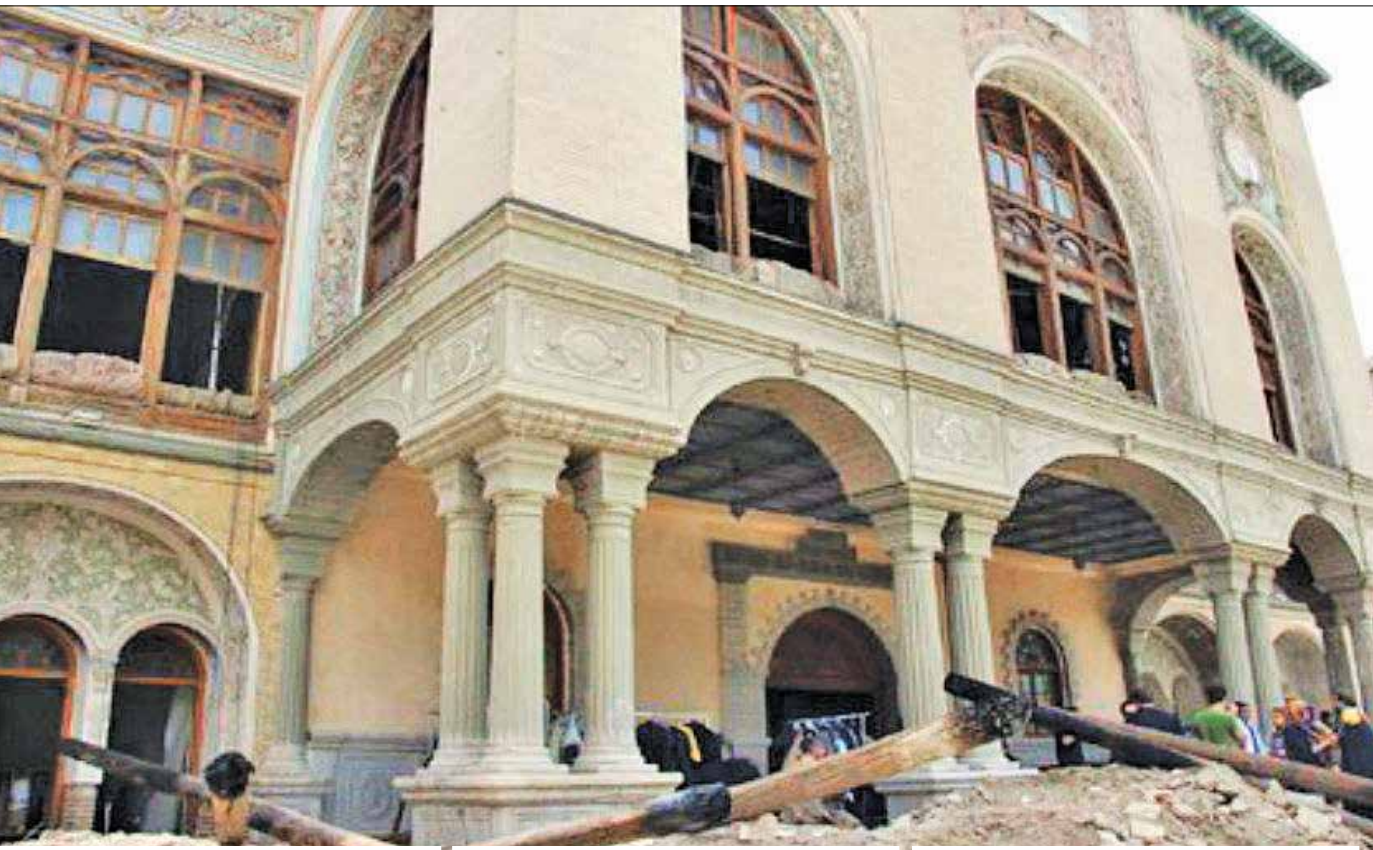
در میان فضای عمومی عمارت عظام توسط کمیسیون مسعودیه نظریه‌یاب شد.

او درباره تغییر کاربری عمارت مسعودیه گفت: هر دو طرف قرارداد متفق‌القول بودند که کاربری اقامتی برای این عمارت مناسب نیست. هزینه بالای مرمت و درآمد کمتر نسبت به کاربری فرهنگی، آموزشی و آسیب بیشتری به بنا) به همین دلیل در سال ۱۳۹۰ یعنی فقط چند ماه بعد از واگذاری، با حضور مدیرعامل وقت صندوق، جلسه برگزار شد تا پیشنهاد شرکت سرمایه‌گذار مبنی بر تغییر کاربری استماع شود. در این جلسه قرار شد برنامه و طرح پیشنهادی خود و توجه اقتصادی آن را به صندوق تحویل دهد تا بررسی حقوقی شود.